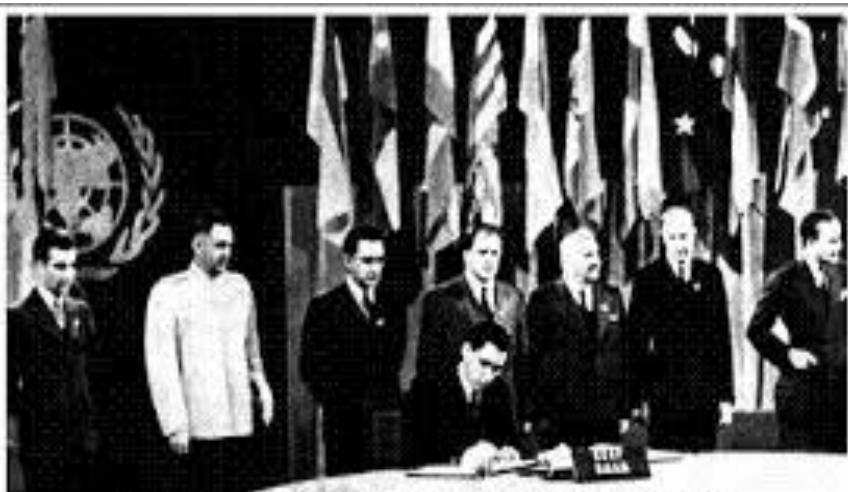
А.А Громыко подписывает Устав ООН. Сан-Франциско. 26 июня 1945 года.

СССР становится постоянным членом Совета Безопасности ООН