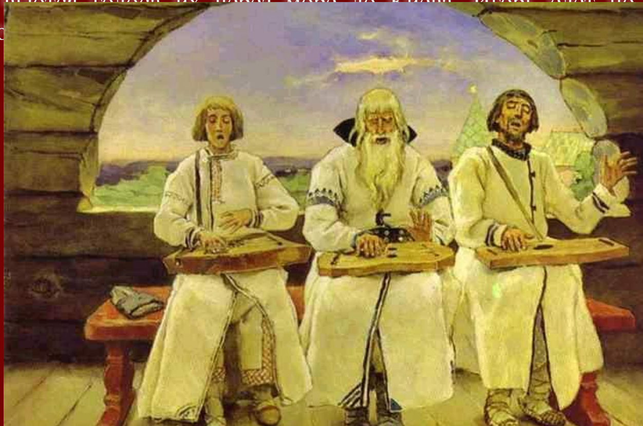
В. Васнецов. Гусляры.

Проявление эмоций автора «Слова» помогает поддерживать образ князя Игоря как положительного героя, несмотря на то что своим безрассудным поступком он поставил под удар собственную Отчизну, а вместе с нею и всех людей русских. Свое отношение к происходящему поэт показывает не только при описании поражения русского войска, но и при повествовании бегства из плена Игоря. В строках песни чувствуется ликование автора, поскольку «как тяжело телу, кроме головы, так тяжело Русской земле без Игоря». Возвращение Игоря на родину отмечено ликованием природы и людей русских: «Солнце светится на небе, — а Игорь-князь в Русской земле; девицы поют на Дунае, — плывет гонец их через море до Киева. Игорь идет по Боричеву ко