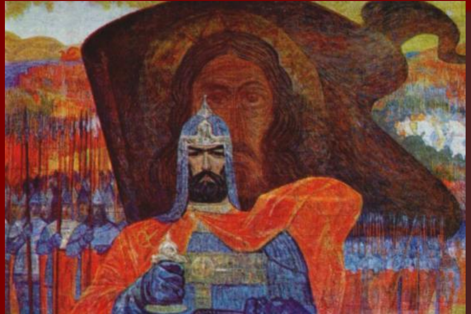
Князь Игорь. Худ. И.