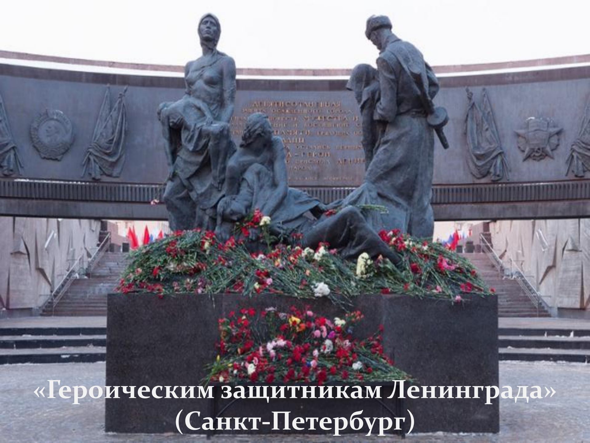
«Героическим защитникам Ленинграда» (Санкт-Петербург)