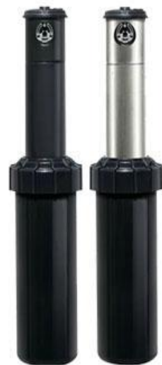
РОТОРЫ (роторные дождеватели)