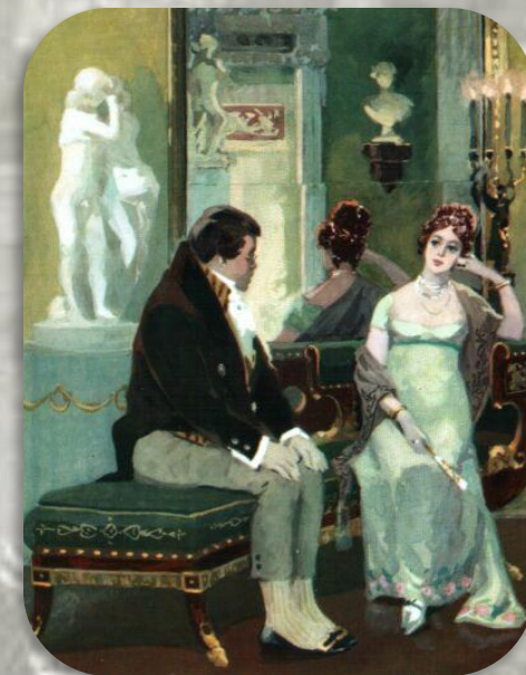
Иллюстрация к роману «Война и мир»

Наблюдая за поведением представителей знати после объявления Пьера наследником огромного состояния, выяснили, что Толстой сравнивает высшее общество с прядильной мастерской, в которой "веретена с разных сторон равномерно и не умолкая шумели". Но в этих мастерских решаются важные дела, плетутся государственные интриги, решаются личные проблемы, намечаются корыстные планы: подыскиваются места для неустроенных сынков, намечаются выгодные партии для женитьбы или замужества.