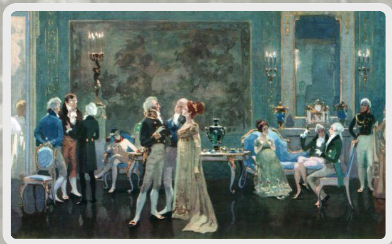
«Салон А.П. Шерер» Иллюстрация к роману «Война и мир»

С первых страниц романа мы попадаем в петербургские гостиные большого света и знакомимся со "сливками" этого общества: вельможами, сановниками, дипломатами, фрейлинами. Толстой срывает покровы внешнего блеска, утонченных манер с этих людей, и перед читателем предстает их духовное убожество, нравственная низость. В их поведении, в их взаимоотношениях нет ни простоты, ни добра, ни правды.