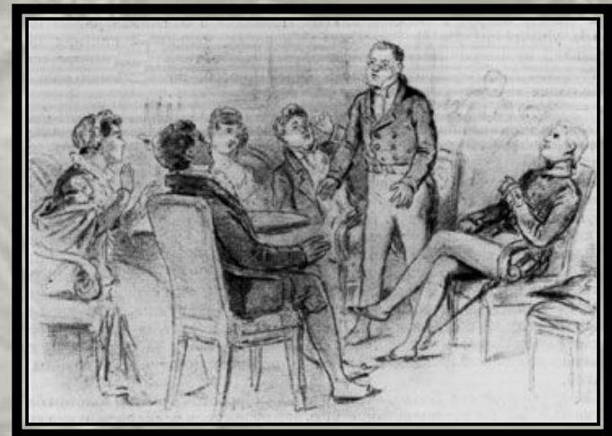
Пьер в салоне А.П. Шерер