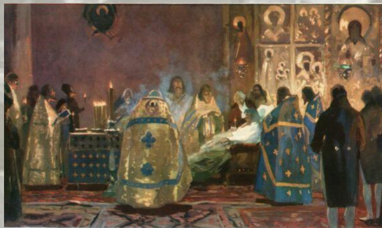
Иллюстрация к роману «Война и мир»