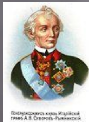
Генералиссимус князь Италийский гвард. А.В. Суворов-Рымникский