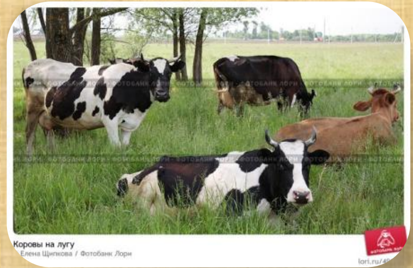
Коровы на лугу