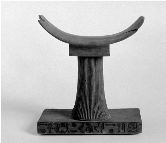
Древняя Египетская подушка