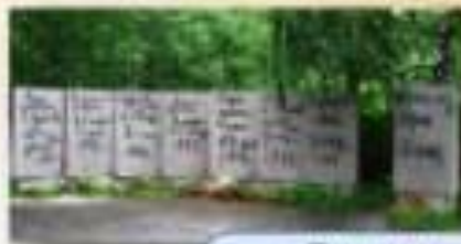
«Дневник Тани Савичевой»