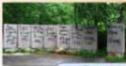
«Дневник Тани Савичевой»