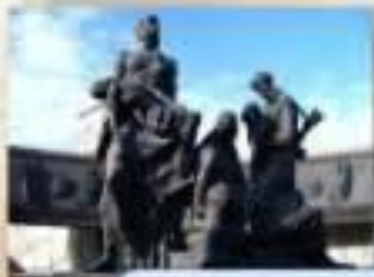
«Героическим защитникам города»