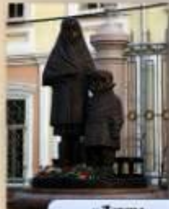
«Детям блокадного Ленинграда»