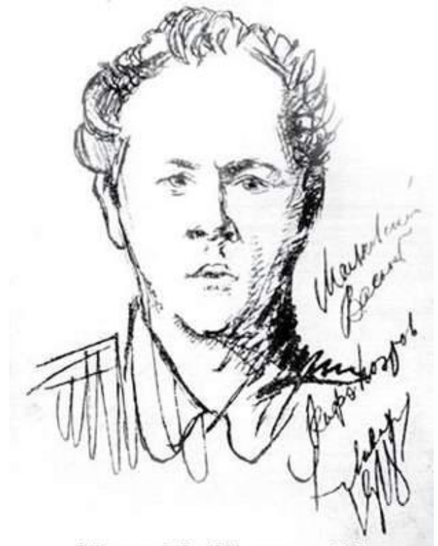
В.Каменский. Рис. В.Маяковского. 1917 г