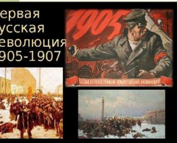
Первая русская революция 1905-1907