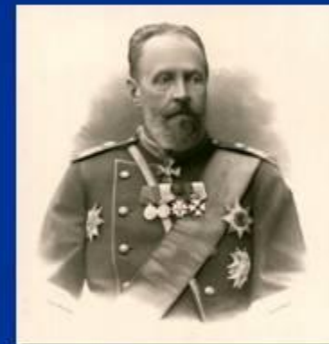
Сергей Юльевич Витте