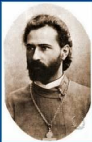
Георгий Аполлонович Гапон