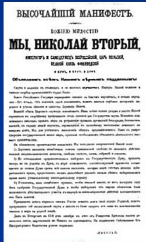
Манифест 17 октября