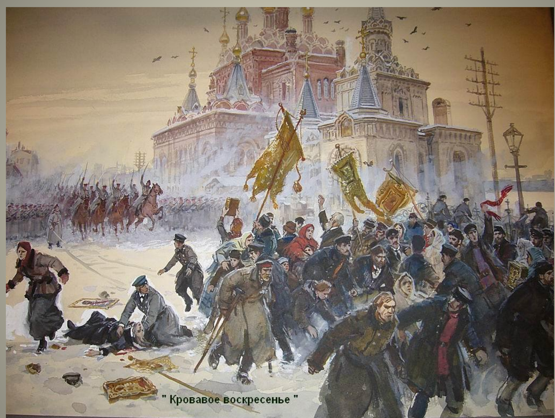
" Кровавое воскресенье "