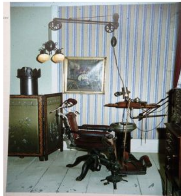
Фотография зубоврачебного кабинета начала XX века