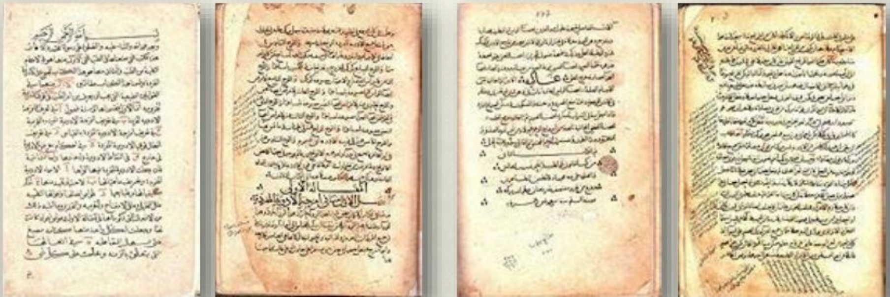
Копия рукописи «Канон врачебной науки» (Аль-Ганун Фи ат-Тибб) Ибн Сины 1030 года, сделанная в 1143 в Багдаде. Институт рукописей Национальной Академии наук Азербайджана в Баку