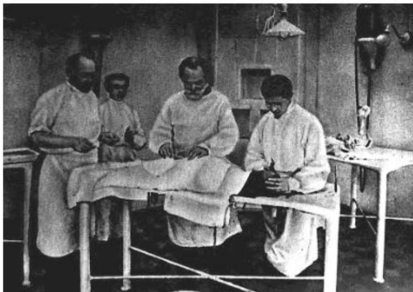
И.П. Павлов оперирует.