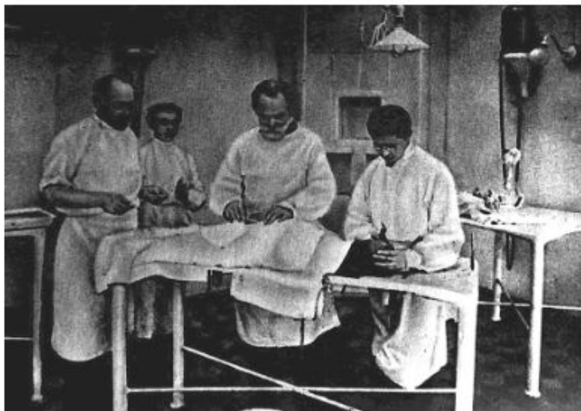
И.П. Павлов оперирует.