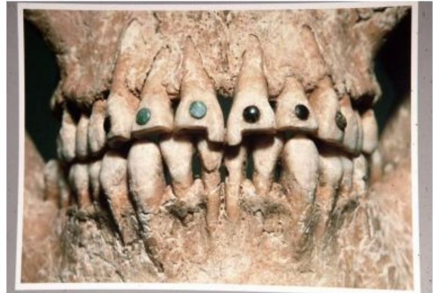
Зубы черепа индейца-майя (ок. IX в. н.э.) содержат импланты из нефрита и бирюзы

пол, возраст, болезни – рахит, кариес, травмы, опухоли, туберкулез и др.