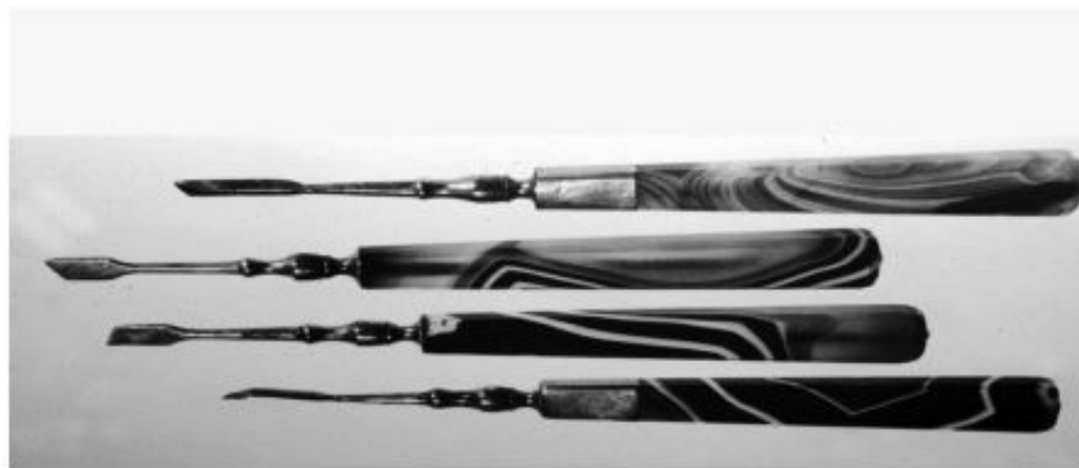
Долота и экскаваторы. Ручки из оникса. 1860 г. Медицинский музей Гарвардского университета, Бостон