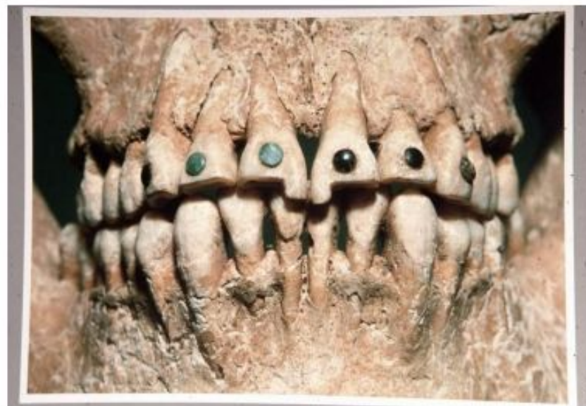
Зубы черепа индейца-майя (ок. IX в. н.э.) содержат импланты из нефрита и бирюзы

пол, возраст, болезни – рахит, кариес, травмы, опухоли, туберкулез и др.