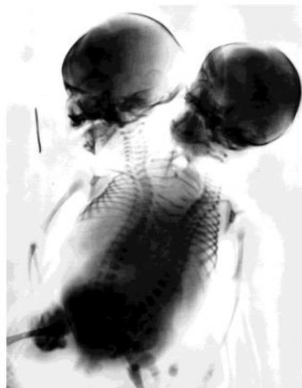
Рентгенограмма сеамских близнецов.