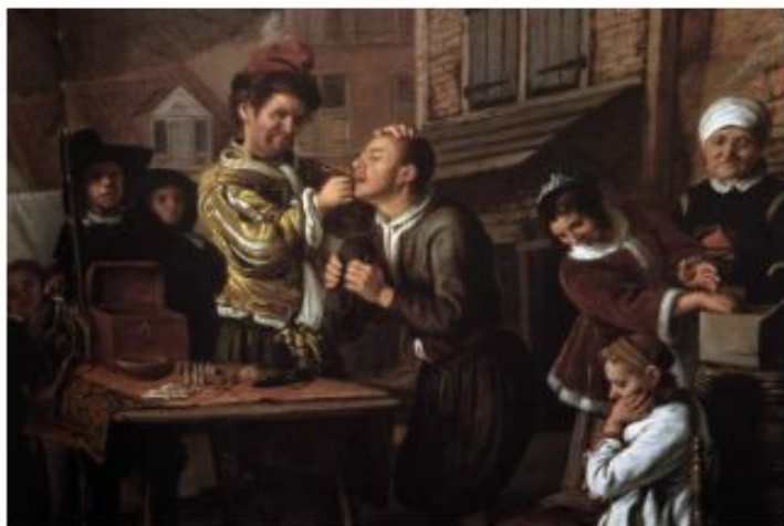
Картина «Странствующий дантист»