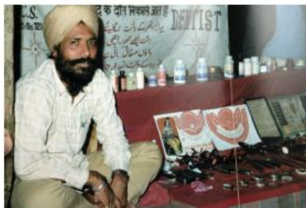
Современный индийский стоматолог