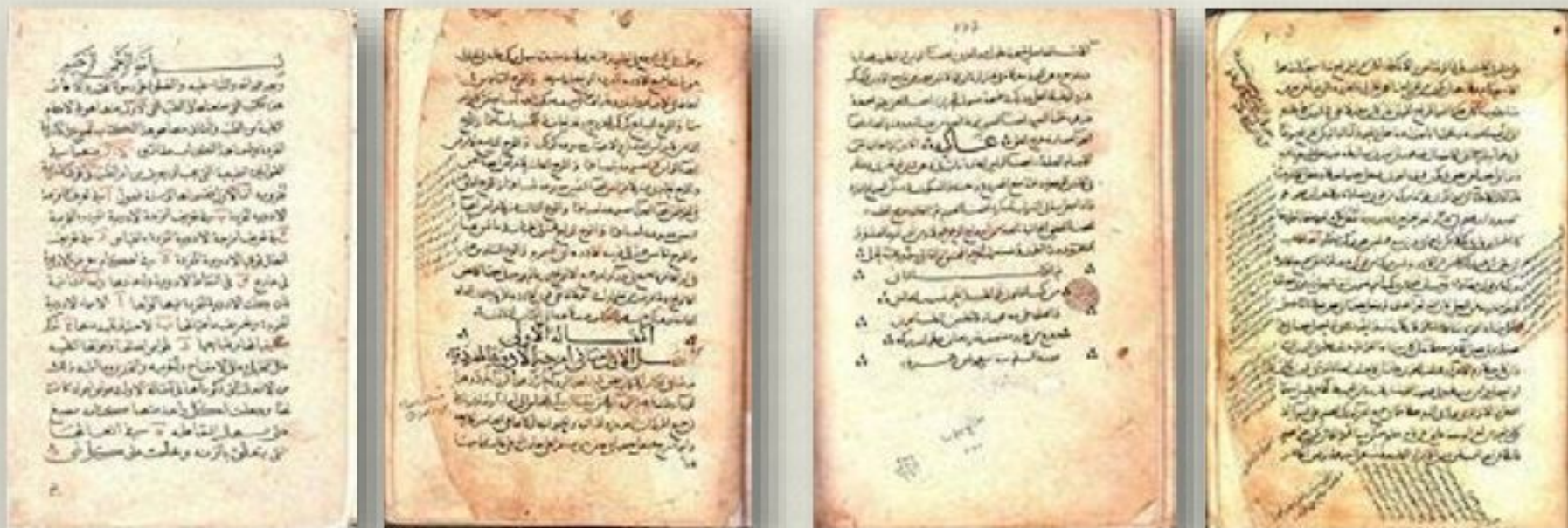
Копия рукописи «Канон врачебной науки» (Аль-Ганун Фи ат-Тибб) Ибн Сины 1030 года, сделанная в 1143 в Багдаде. Институт рукописей Национальной Академии наук Азербайджана в Баку