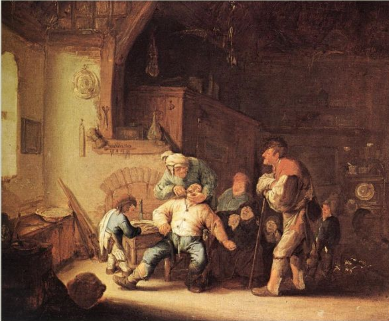
«Парикмахерская» Извлечение Зуба 1630-35 Художественно- исторический музей, Вена