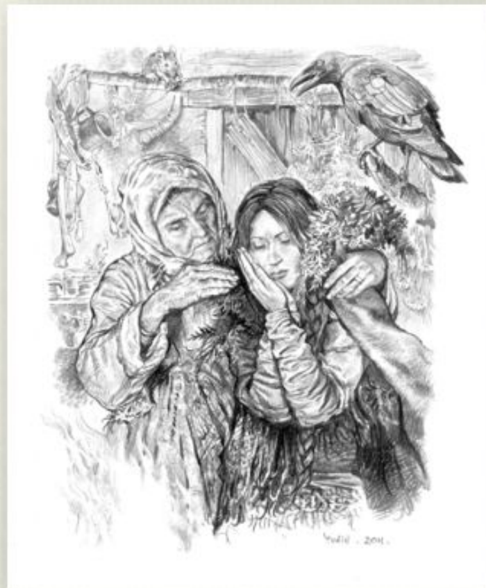
Врачевание в Киевской Руси