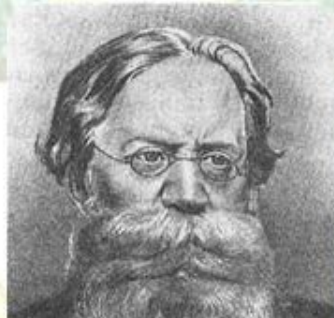
Петр Лаврович Лавров (1823—1900)