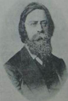
П. Л. Лавров. (70-е годы).

Память великихъ людей всегда объединяет. С чувствомъ особого удовлетворения редакция констатируетъ тотъ фактъ, что чествование 20-тилѣтня со дня смерти Петра Лавровича Лаврова объединило в одномъ сборникѣ представителей самыхъ различныхъ мировоззреній и общественныхъ теченій. К сожалѣнью, «позлащившя обстоятельства» не даютъ возможности отметить эту дату такъ, какъ она того заслуживаетъ и какъ бы хотѣлось всемъ участникамъ настоящаго изданія. И редакция и сотрудники сборника «Впередъ» сознаютъ, что венокъ,