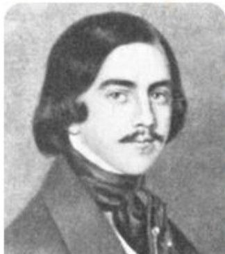
Михаил Александрович Бакунин (1814—1876)