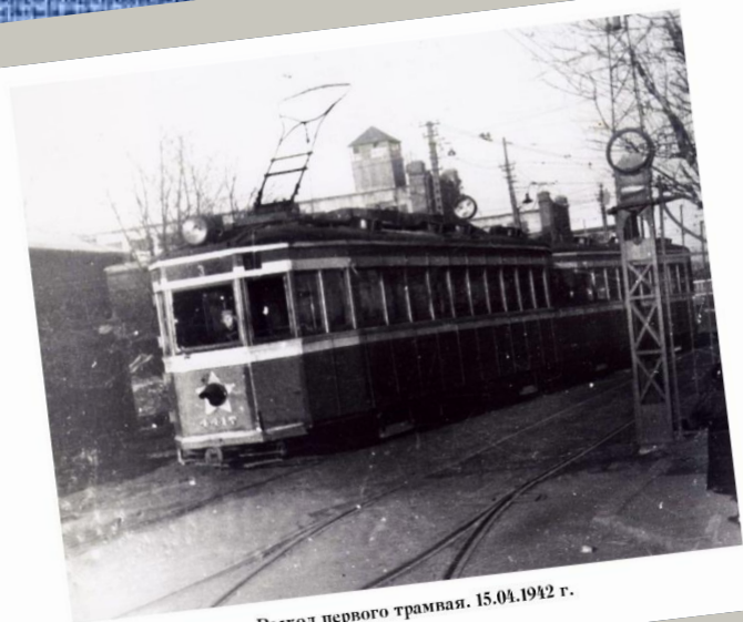
Выход первого трамвая. 15.04.1942 г.

Пережившие блокаду “Американки” еще очень долго работали на улицах Ленинграда. По истечении срока службы из вагонов делали прицепные платформы для перевозки грузов.