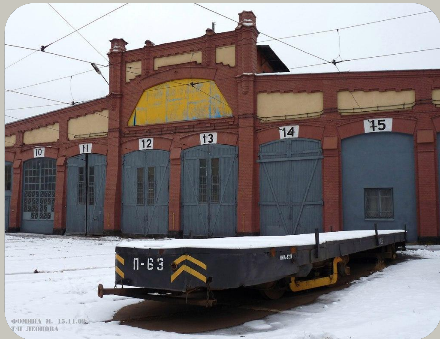
ФОМИНА М. 15.11.09 Т.И. ЛЕОНОВА

Пережившие блокаду “Американки” еще очень долго работали на улицах Ленинграда. По истечении срока службы из вагонов делали прицепные платформы для перевозки грузов.