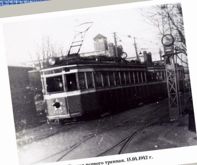
Выход первого трамвая. 15.04.1942 г.

Пережившие блокаду “Американки” еще очень долго работали на улицах Ленинграда. По истечению срока службы из вагонов делали прицепные платформы для перевозки грузов.