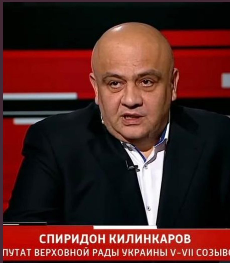
СПИРИДОН КИЛИНКАРОВ ПУТАТ ВЕРХОВНОЙ РАДЫ УКРАИНЫ V-VII СОЗЫВ