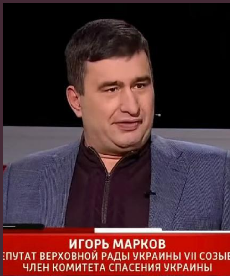
ИГОРЬ МАРКОВ ПУТАТ ВЕРХОВНОЙ РАДЫ УКРАИНЫ VII СОЗЫВ ЧЛЕН КОМИТЕТА СПАСЕНИЯ УКРАИНЫ