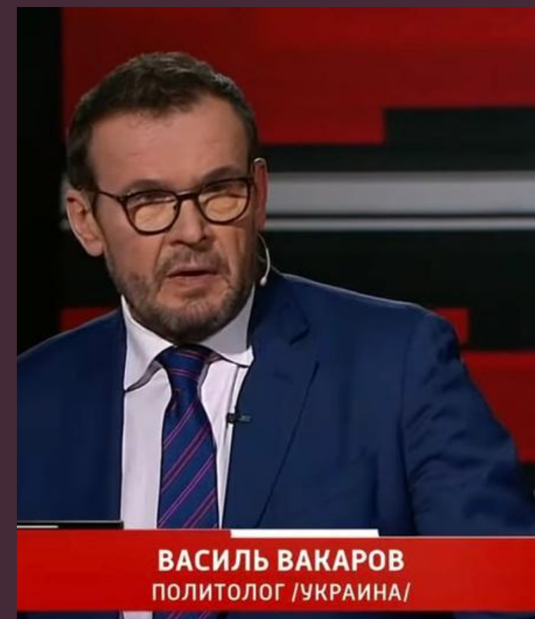
ВАСИЛЬ ВАКАРОВ ПОЛИТОЛОГ /УКРАИНА/