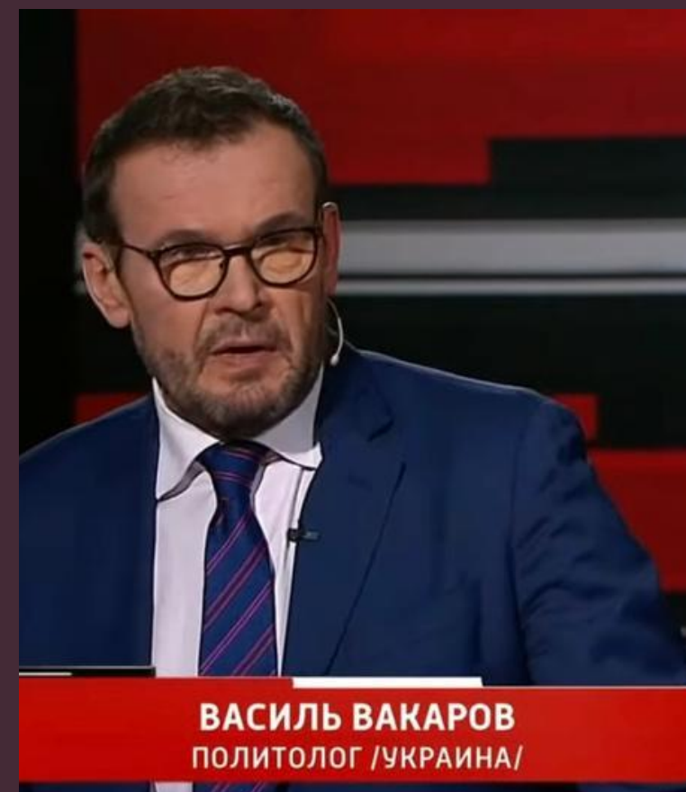
ВАСИЛЬ ВАКАРОВ ПОЛИТОЛОГ /УКРАИНА/