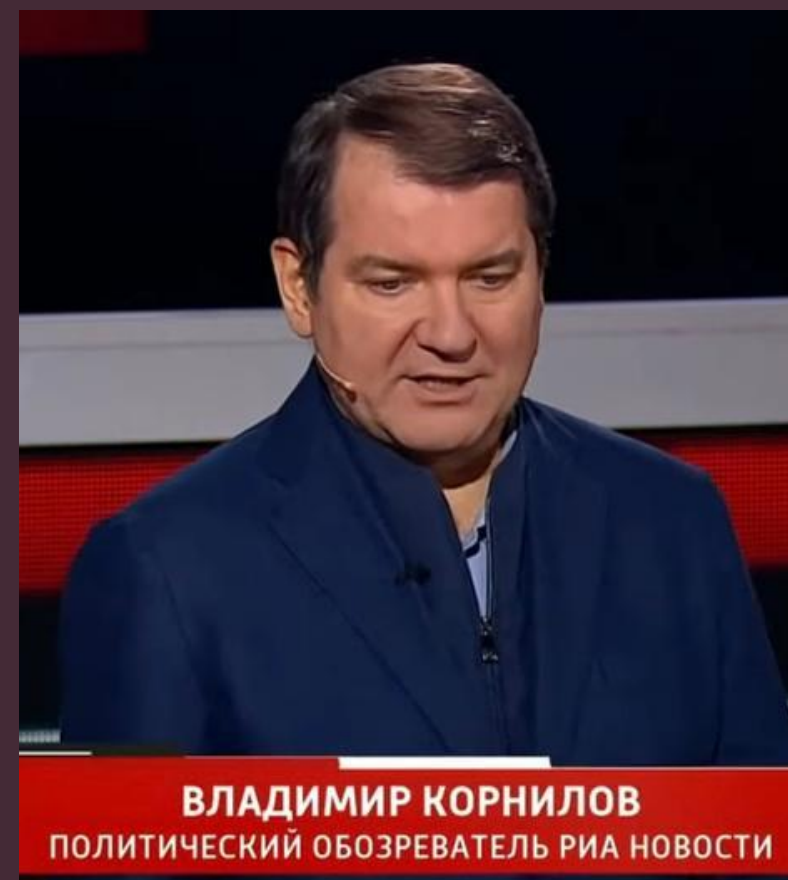
ВЛАДИМИР КОРНИЛОВ ПОЛИТИЧЕСКИЙ ОБОЗРЕВАТЕЛЬ РИА НОВОСТИ