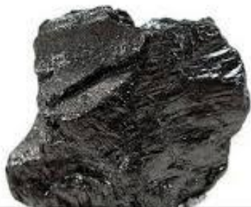
Антрацен Кристаллический углеводород, получаемый из каменноугольной смолы