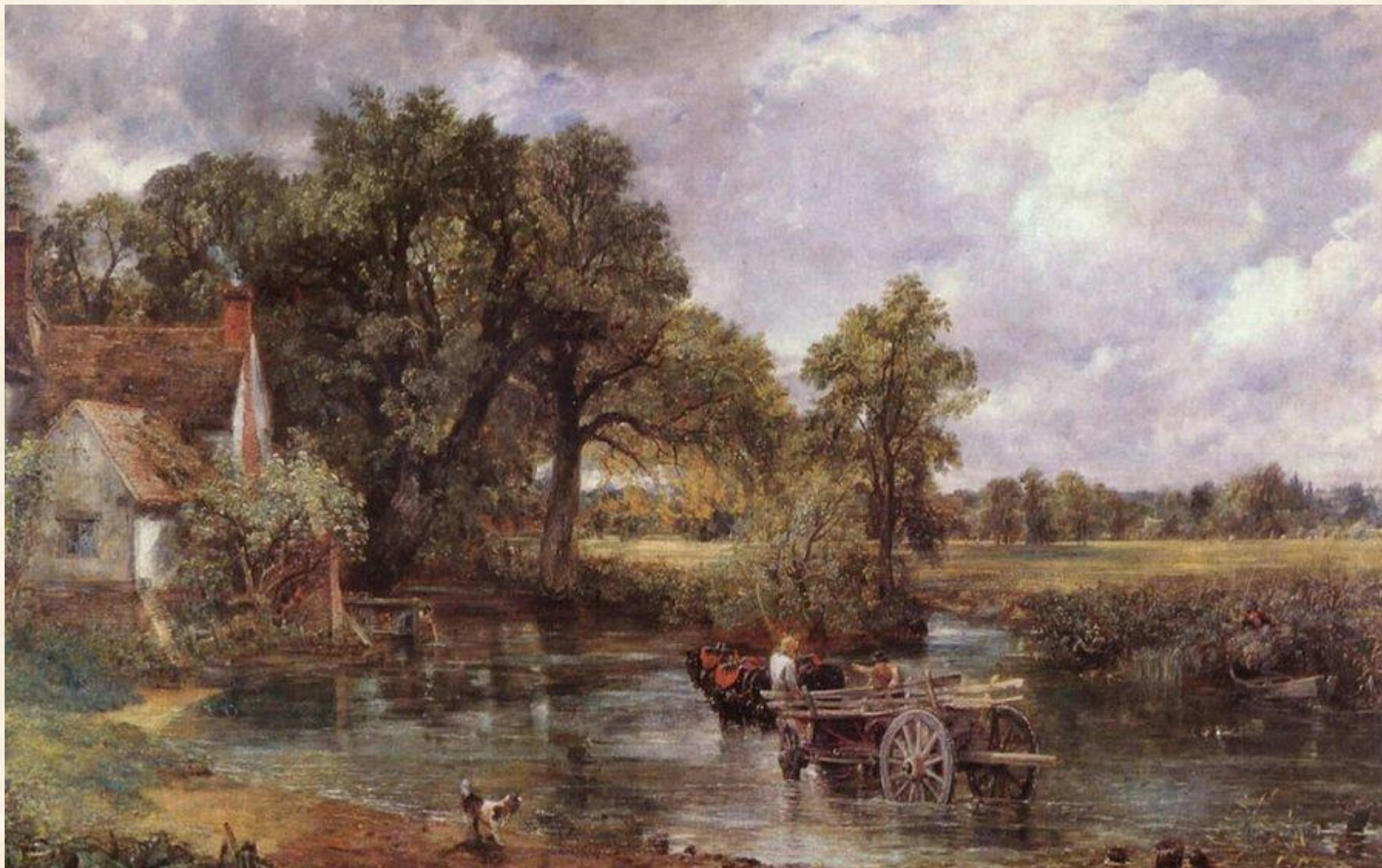
Телега для сена. 1821 г.