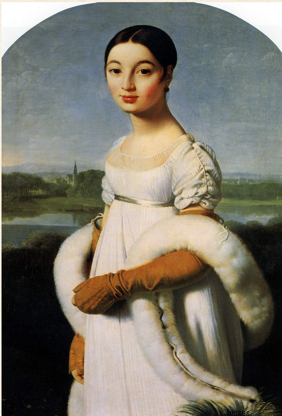
Портрет мадемуазель Ривьер. 1805 г.