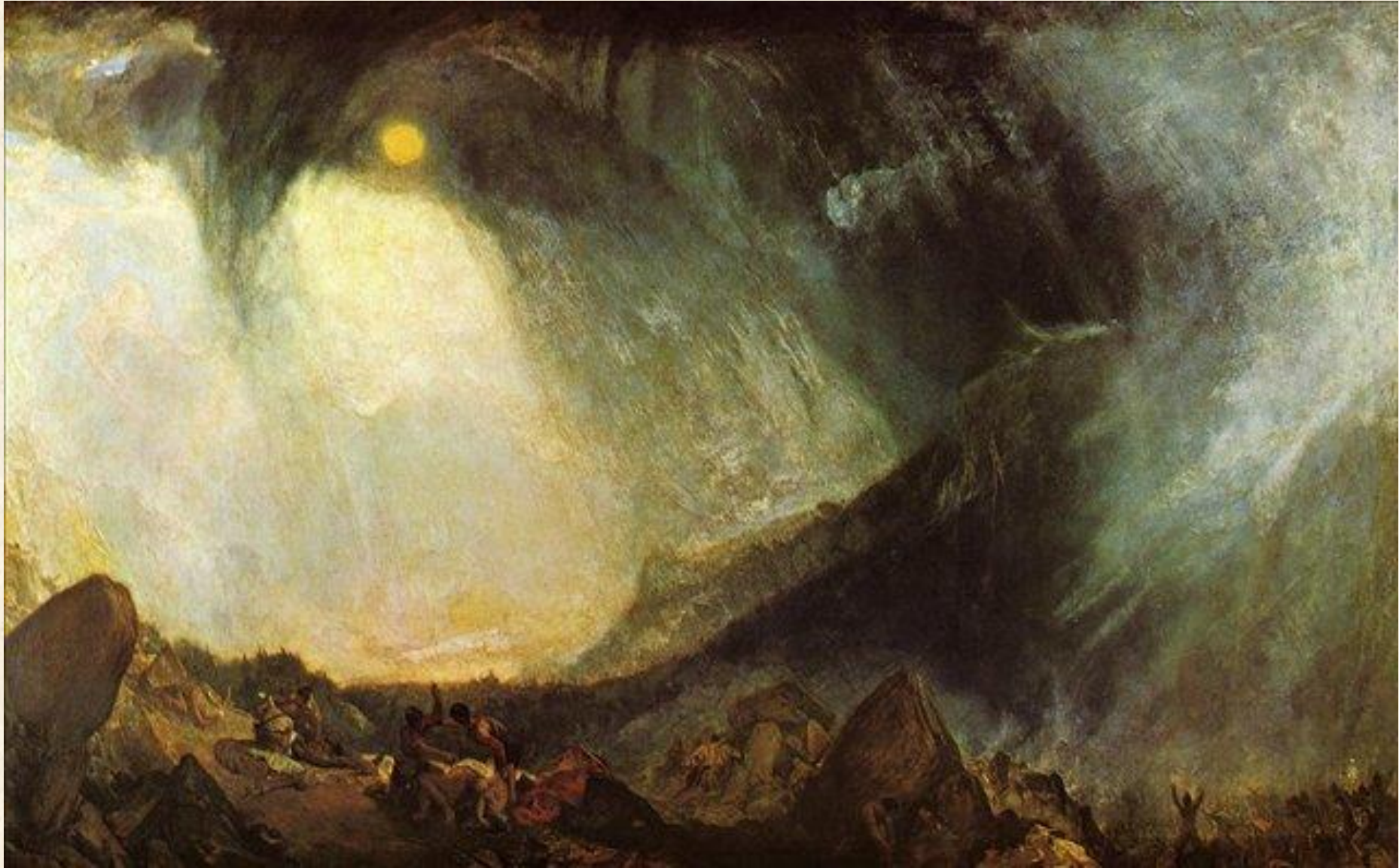
Снежная буря. Переход Ганнибала через Альпы. 1812 г.