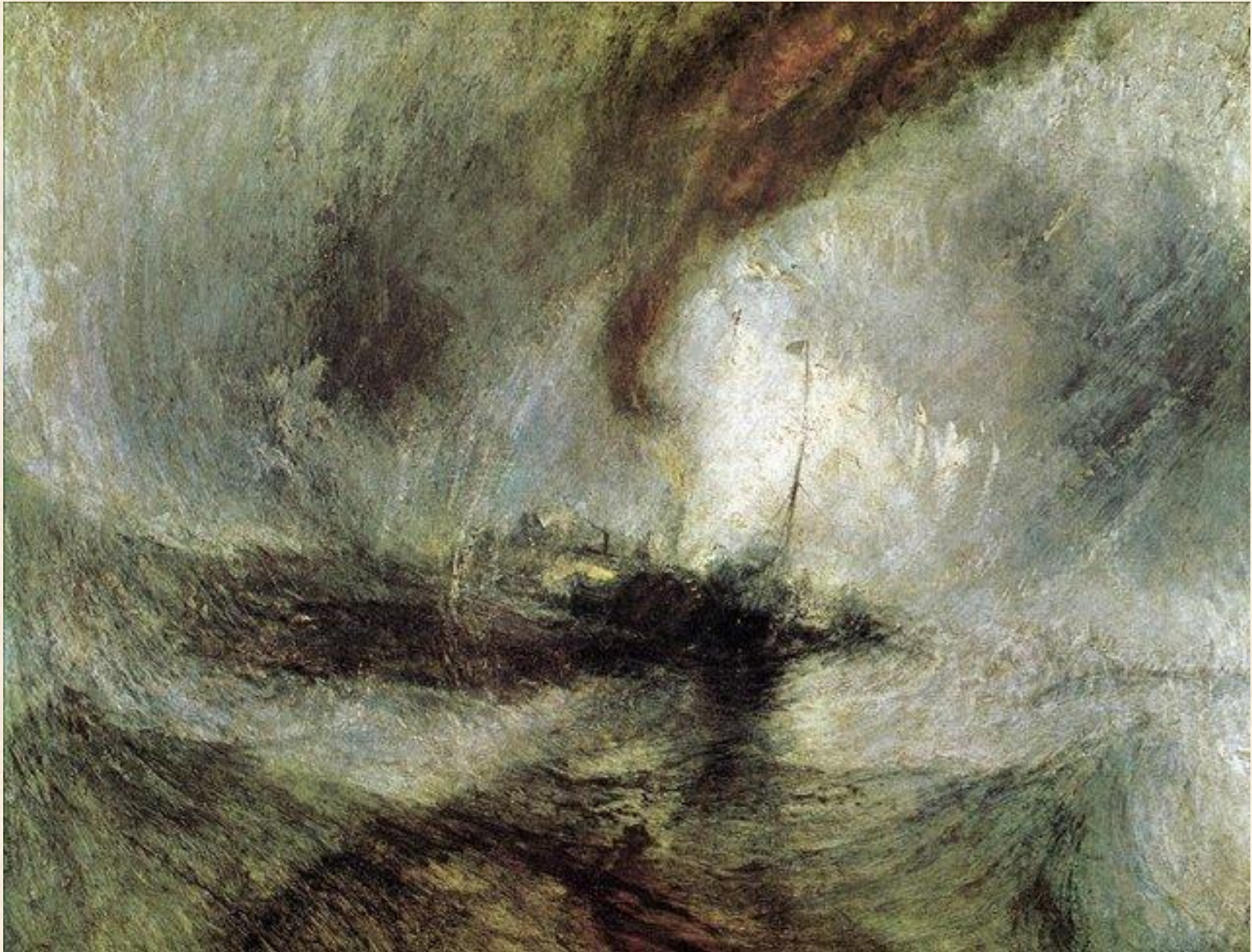
Снежная буря – пароход выходит из гавани, подавая сигналы на мелководье и измеряя глубину потом. 1842 г.