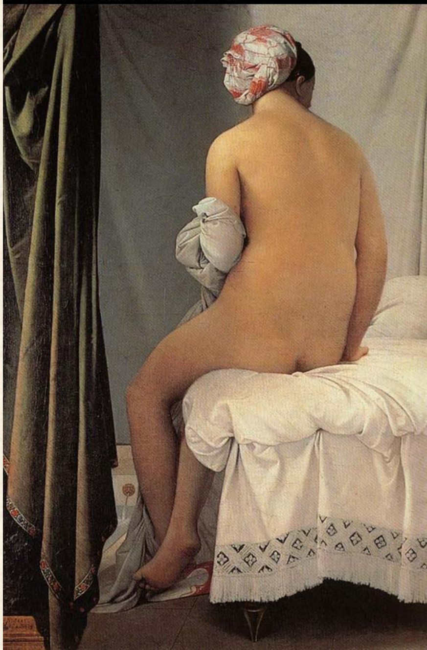
Большая купальщица. 1808 г.