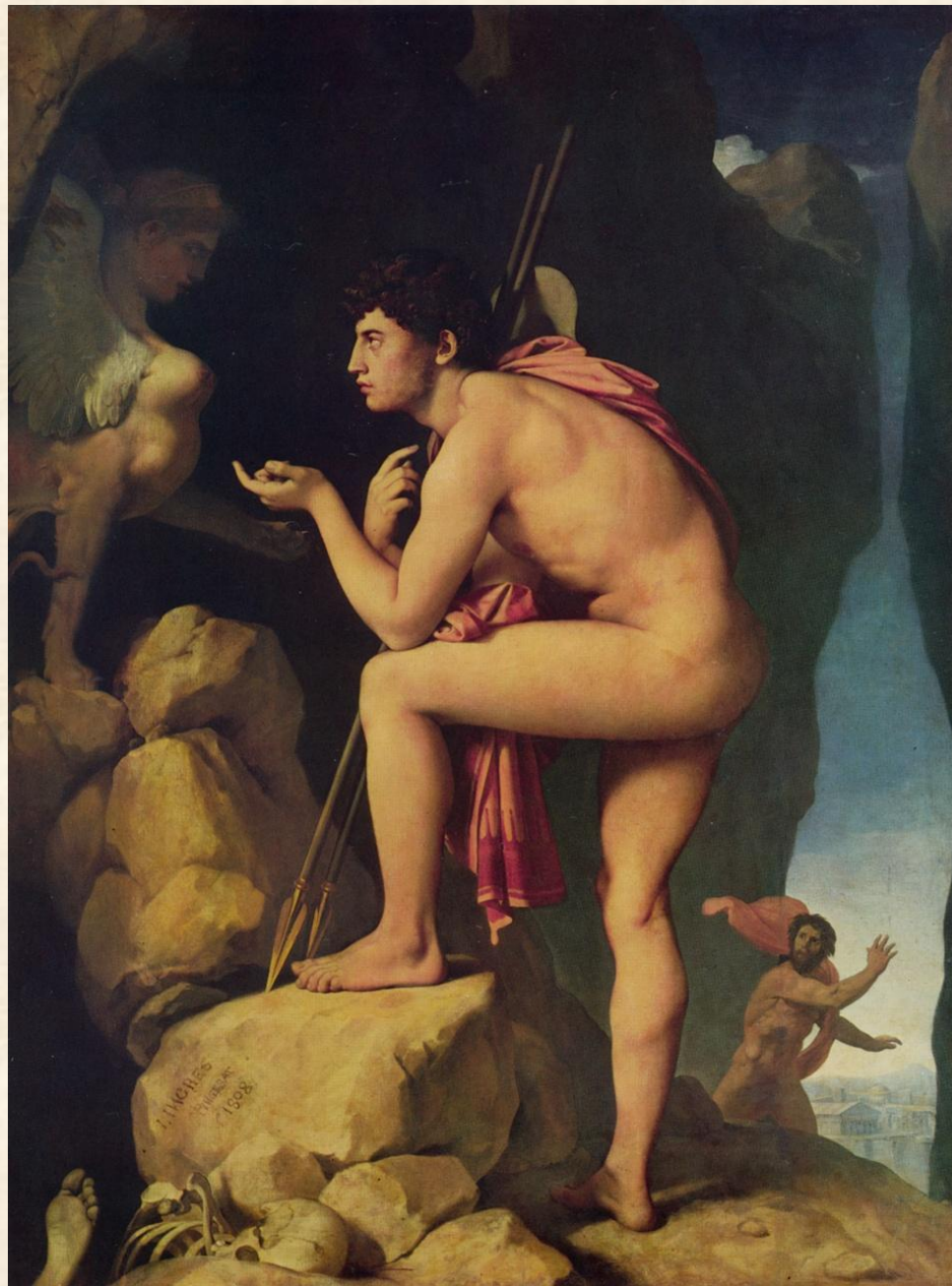
Эдип и Сфинкс. 1808 г.