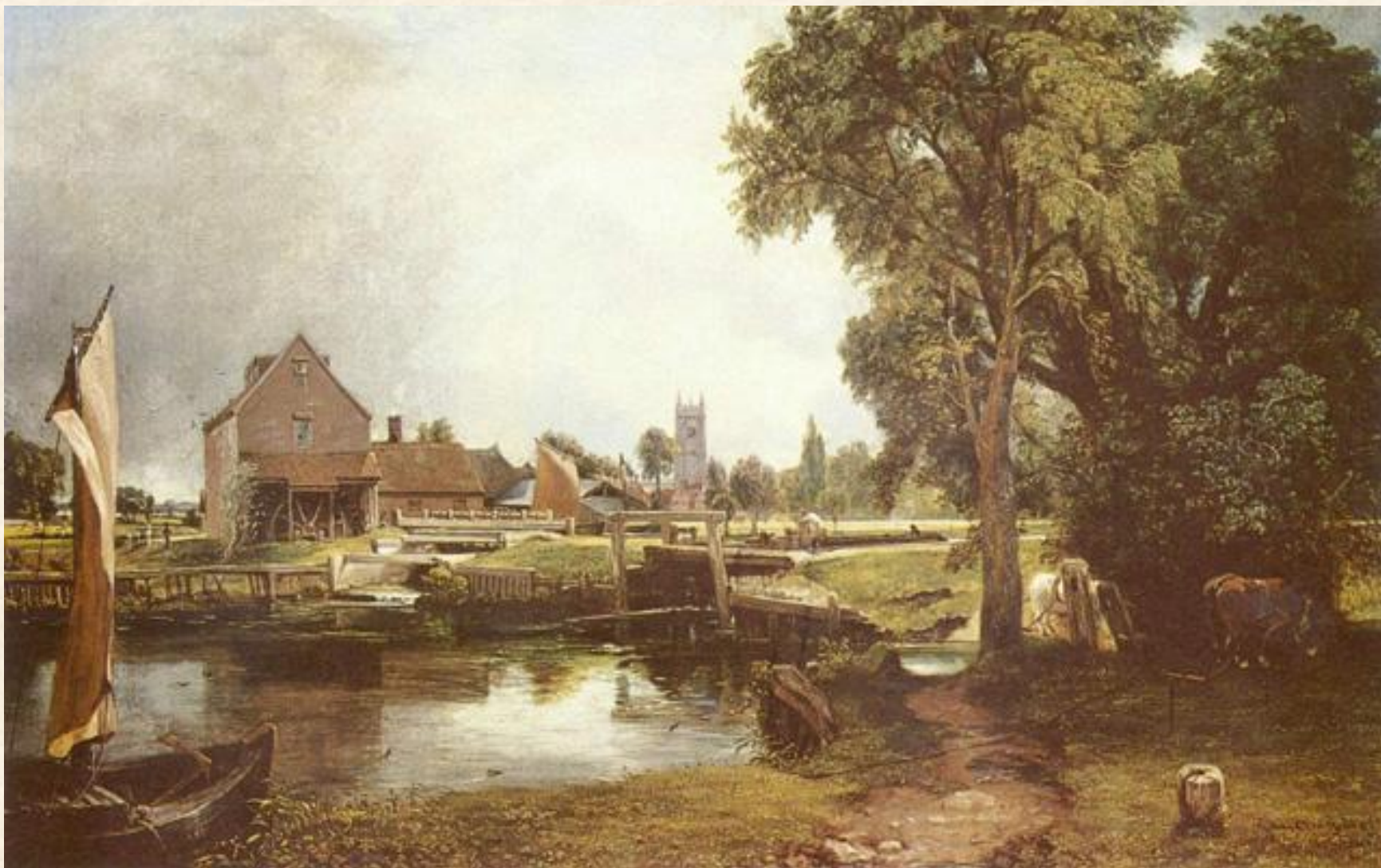
Плотина и мельница в Дедхеме. 1820 г.