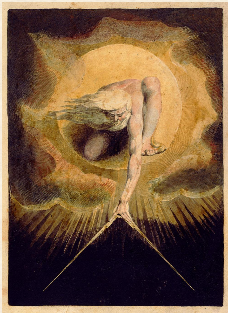
Творец вселенной. Фронтиспис к поэме «Европа», 1794 г.