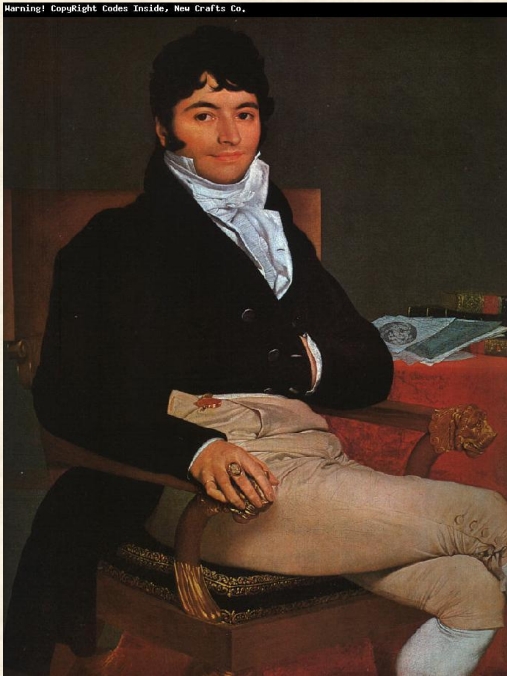
Портрет Филибера Ривьера. 1805 г.