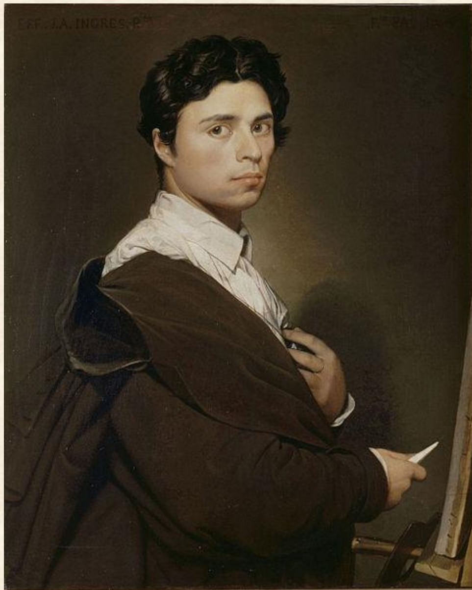
Жан Огюст Доменик Энгр. Автопортрет.