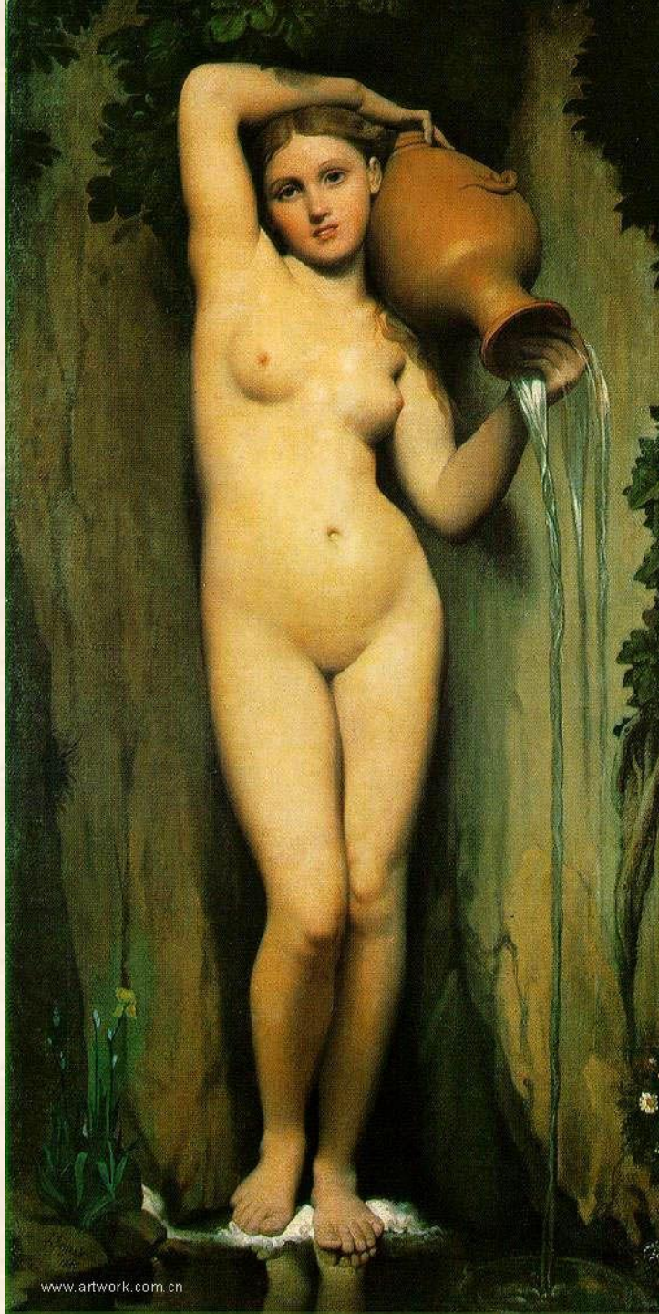
Источник. 1856 г.