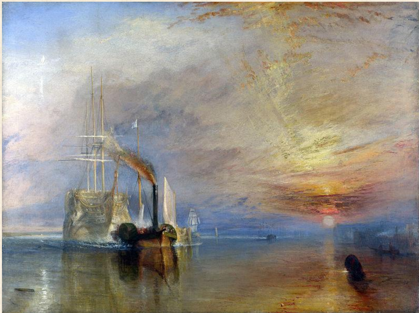
Последний рейс корабля «Отважный». 1839 г.