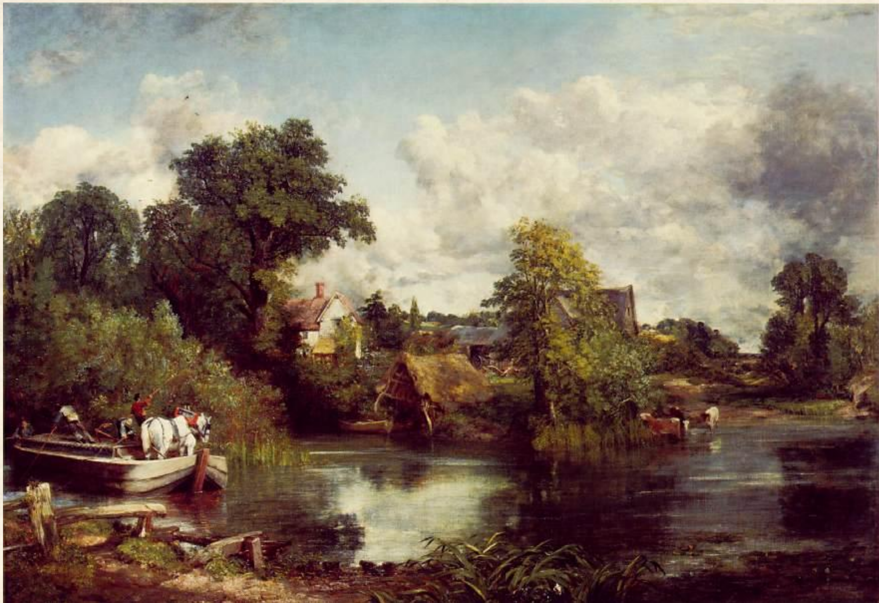
Белая лошадь. 1819 г.