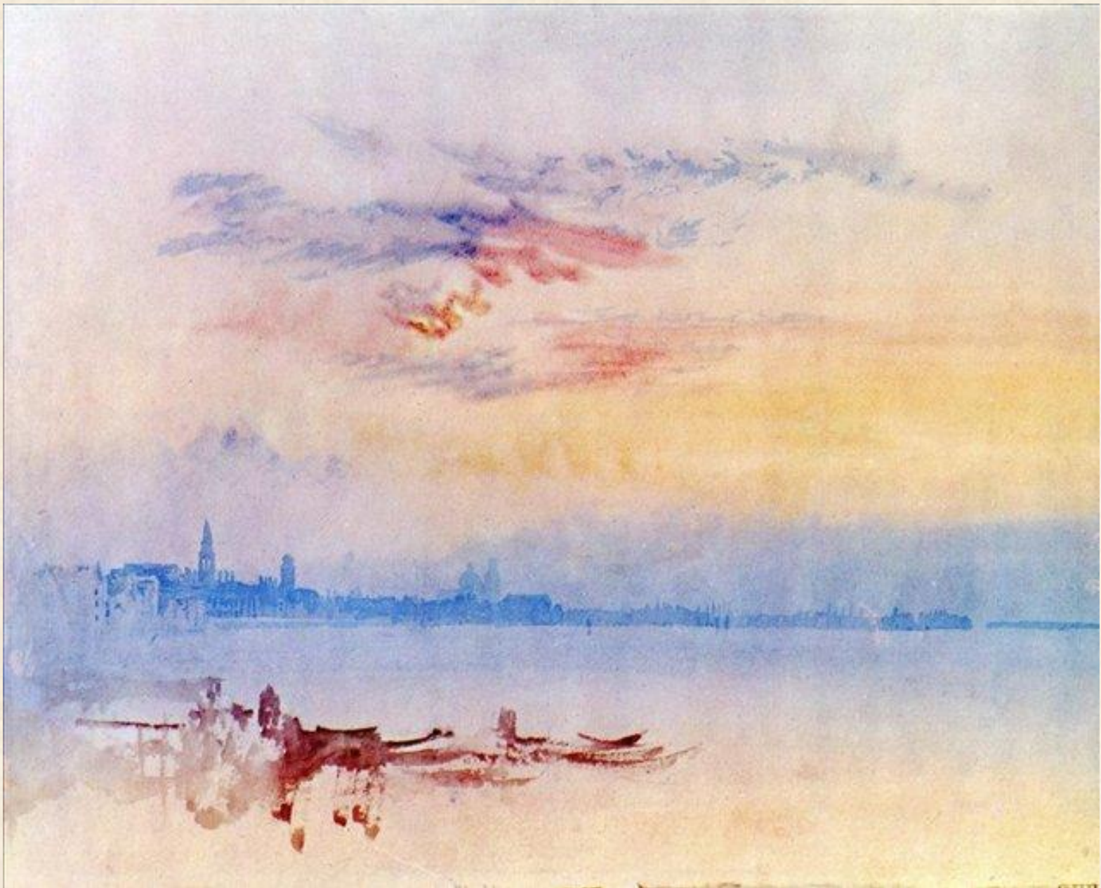
Венеция, вид восточнее Джудекка, восход солнца. 1819 г.