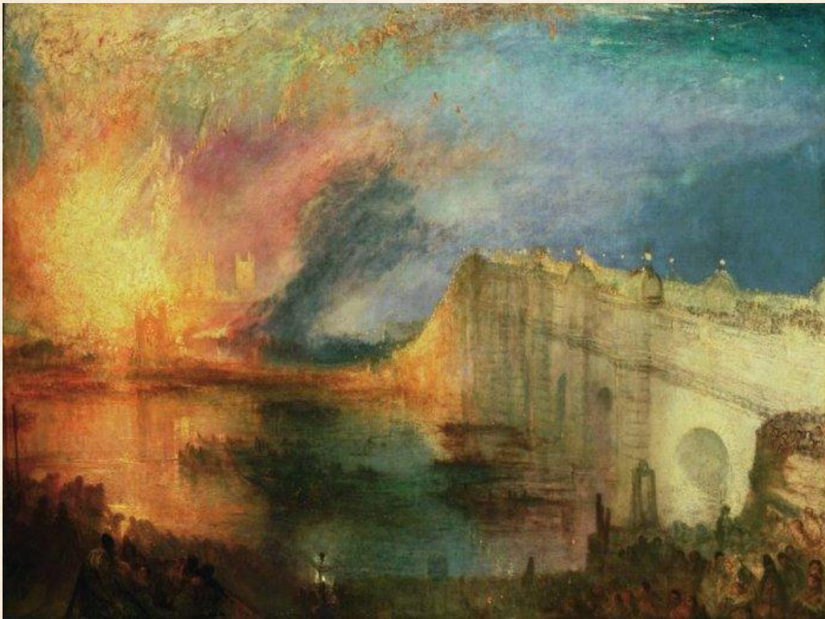
Пожар лондонского Парламента. 1835 г.