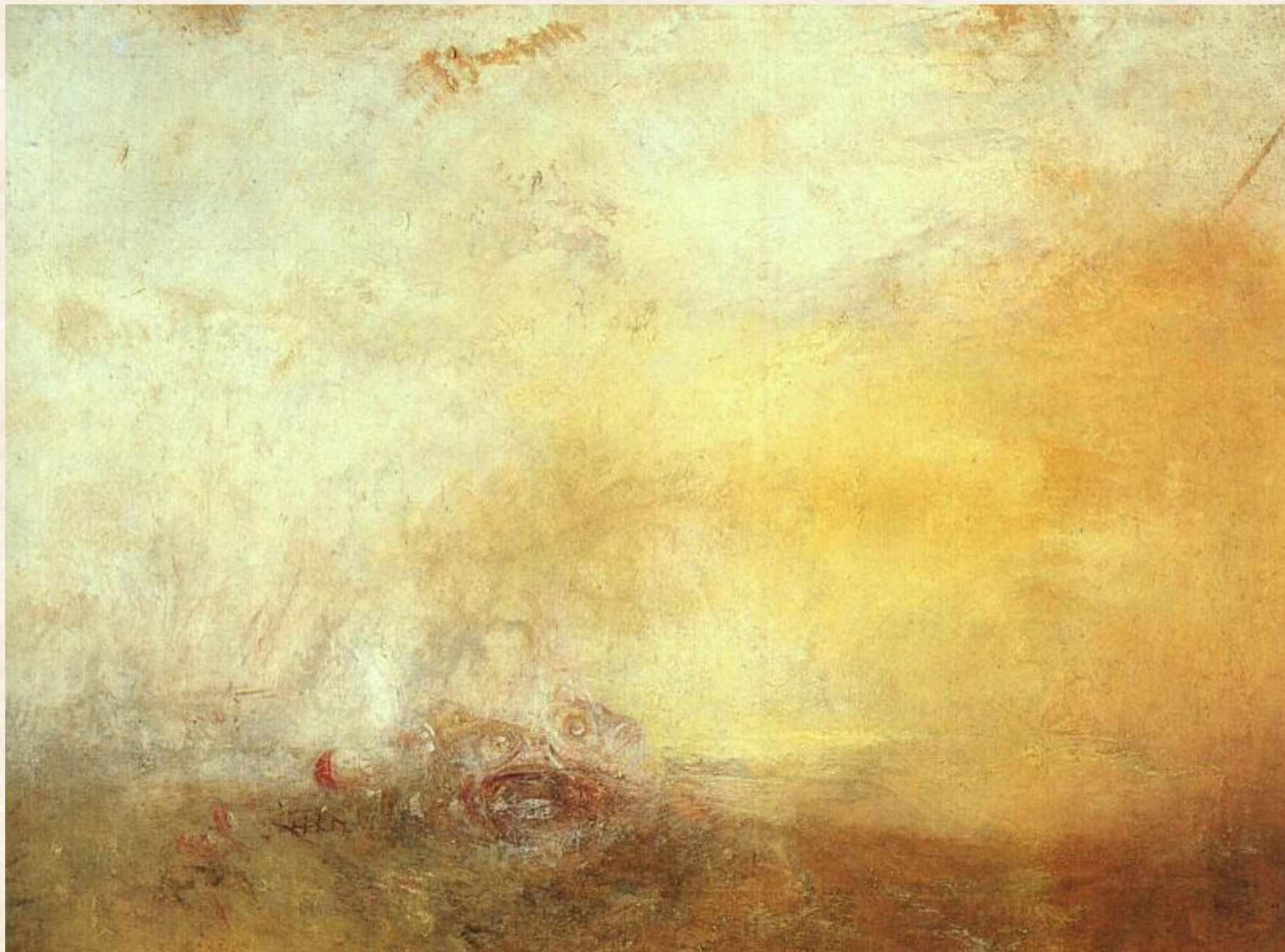
Восход с морскими чудовищами. 1845 г.