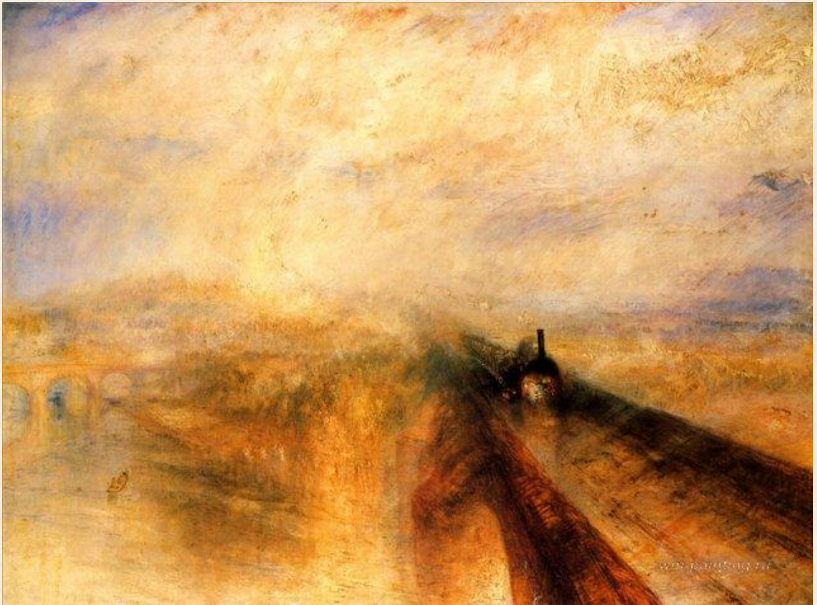
Дождь, пар и скорость – Большая Западная Железная дорога. 1844 г.