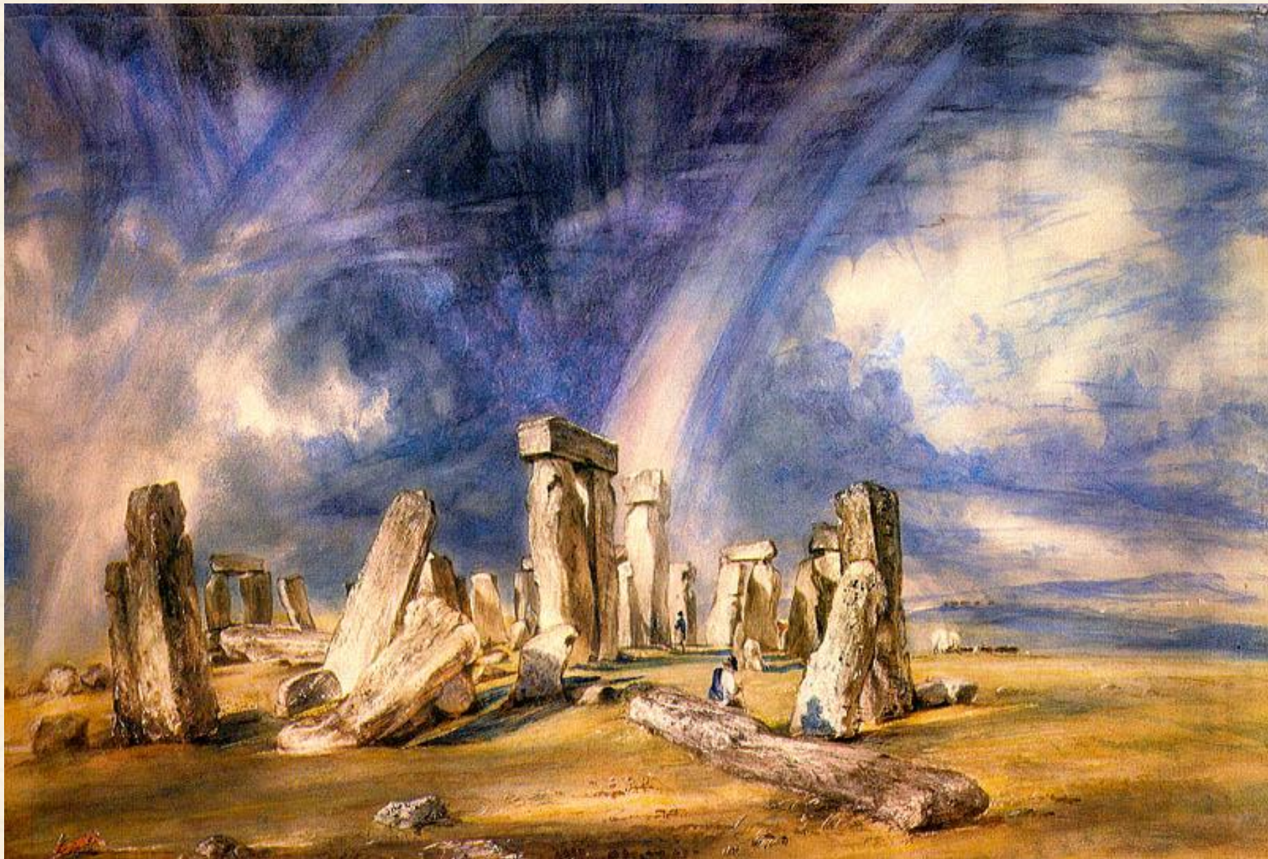
Стоунхендж. 1835 г.