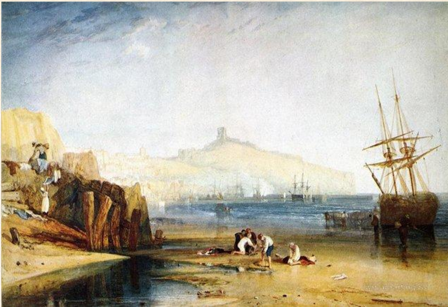
Город и замок Скарборо, утро, мальчики ловят крабов. 1811 г.