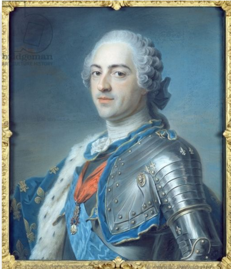
Людовик XV (1710-1774)