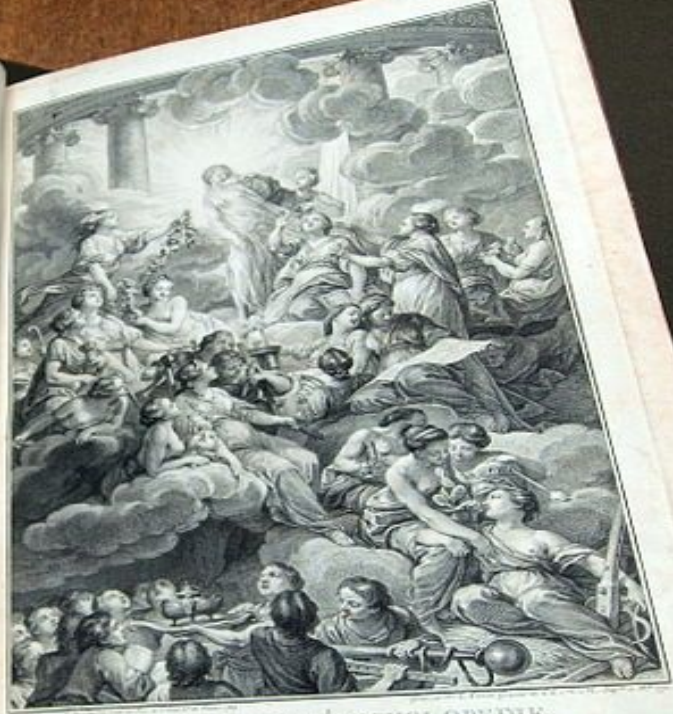
FRONTISPICE DE L'ENCYCLOPÉDIE.

Дидро и его соавторы пытались опубликовать все возможные человеческие знания, что каждый имел возможность их прочитать. Метод организации этой энциклопедии представляет собой идеи просвещения.