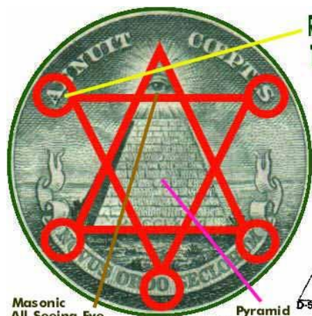
Masonic All Seeing Eye Pyramid is a Phallic Symbol

Reading Clockwise Starting with A = ASMON The Anagram For: MASON or FREEMASON