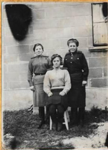
(на фото посередине)