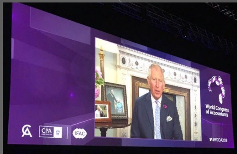
The 20th World Congress of Accountants