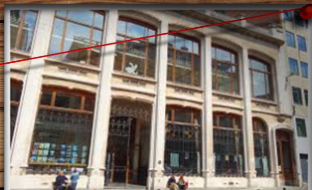
Бельгійський центр коміксів