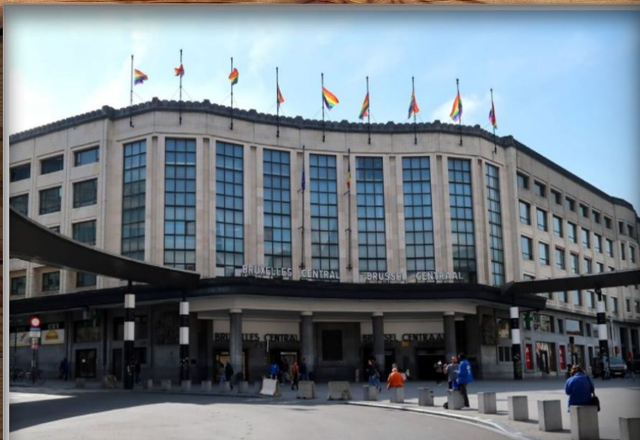
Залізничний вокзал в Брюсселі