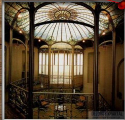
Особняк ван Етвельде