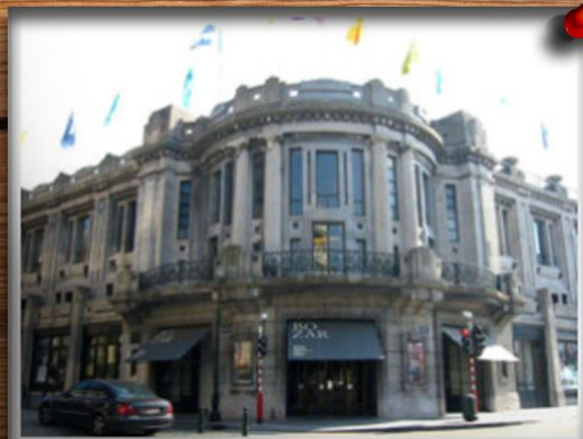
Палац образотворчих мистецтв