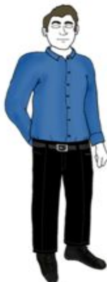
Элегантный повседневный стиль