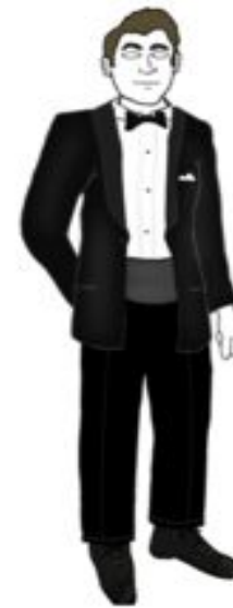
Деловой стиль для особых случаев