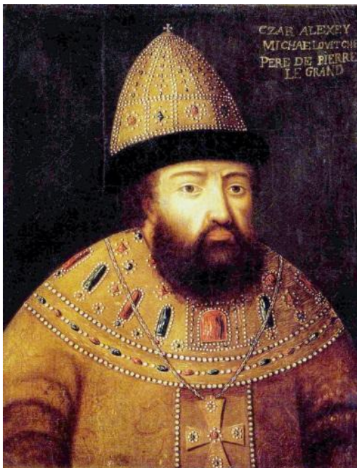
Алексей Михайлович Тишайший 17 (27) марта 1629 – 29 января (8 февраля) 1676