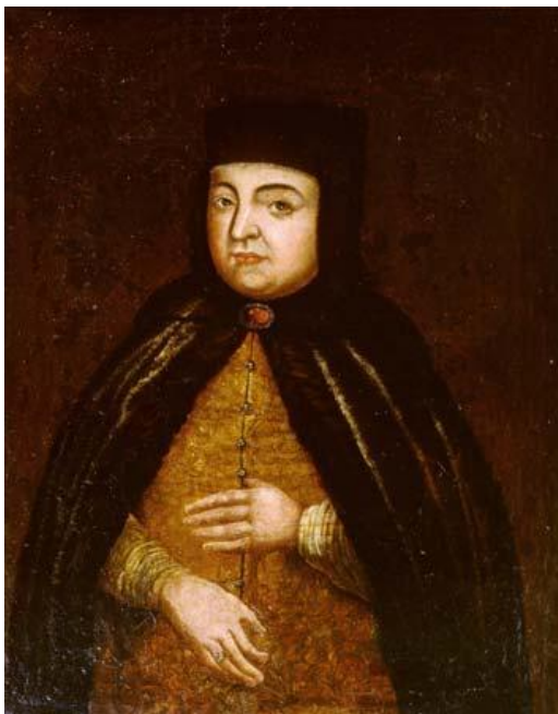
Наталья Кирилловна Нарышкина 22 августа (1 сентября) 1651 – 25 января (4 февраля) 1694