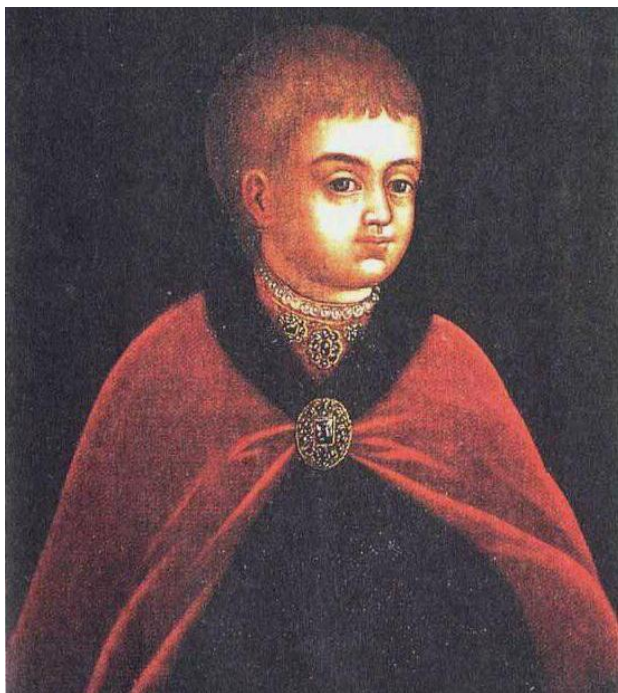
Петр Алексеевич 30 мая (9 июня) 1672 – 28 января (8 февраля) 1725