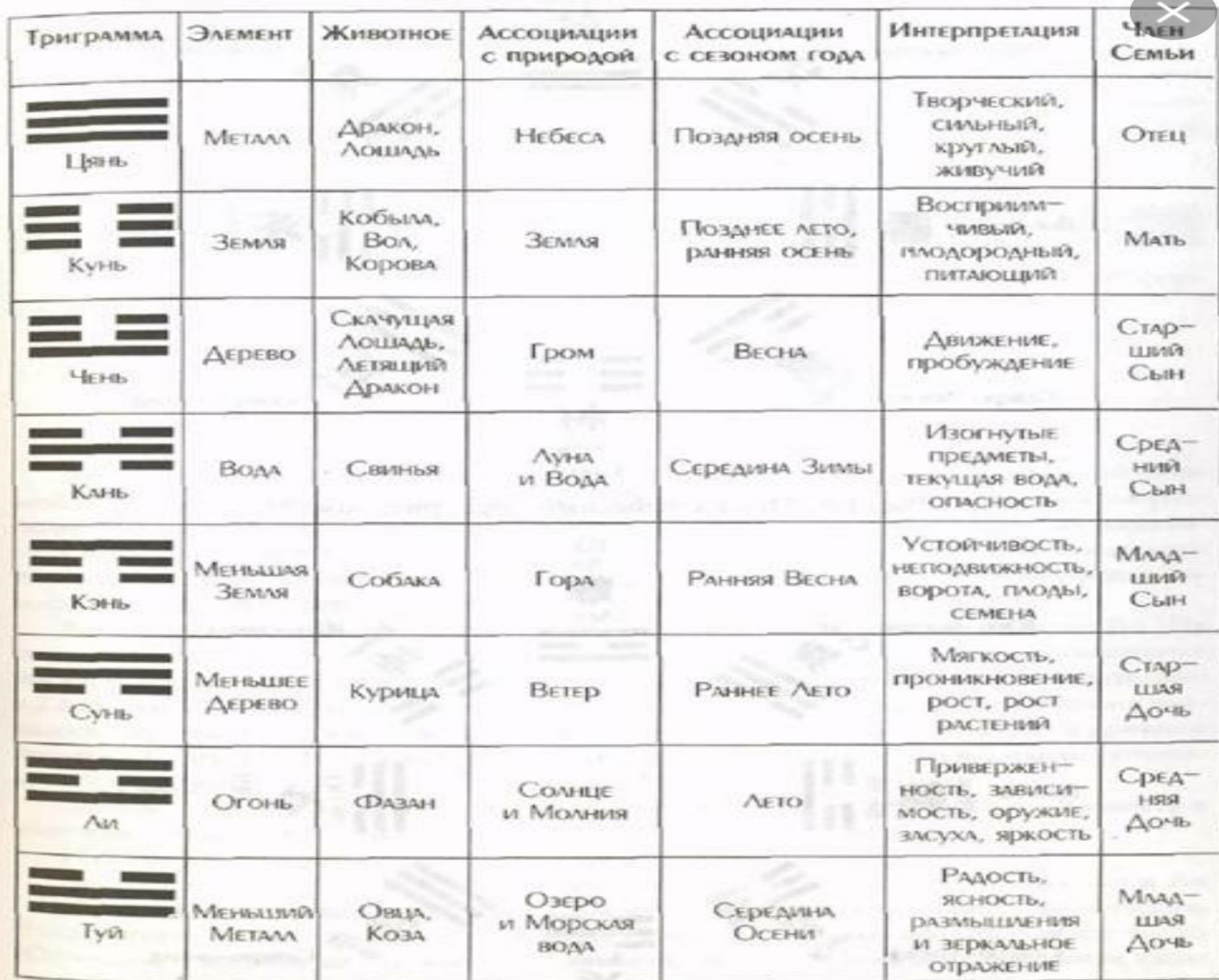
Таблица 1.1. Триграммы и соответствия