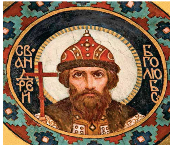
Андрей Боголюбский (1111 г. - 1174 г.)

Родился Роман примерно в 1150 году в семье князя Мстислава Изяславича и польской княжны Агнешки, дочери Болеслава III Кривоустого. Пока отец активно участвовал в усобицах и боролся за Киев, Роман воспитывался в Польше. В дальнейшем его связи с поляками останутся достаточно тесными, и по воле судьбы именно они сыграют в его жизни роковую роль. Впервые Роман зарекомендовал себя как правитель в Новгороде, будучи приглашенным туда жителями города. Там он пробыл князем с 1168 по 1170 годы. Этот период оказался связан со множеством событий, вызванных идущей на Русь усобицы, где главным противником коалиции князей, в которую входил Роман, выступил Андрей Боголюбский.