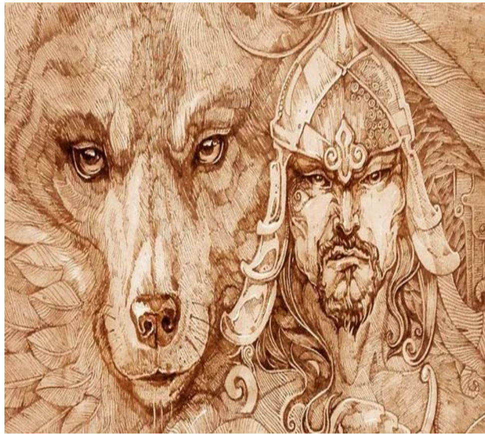
Беклярбек Ногай (12XX г. - 1299 г.)