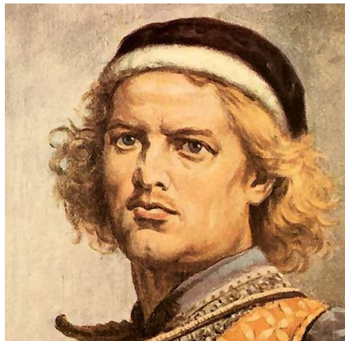
Лешек Белый (1186 г. - 1227 г.)

После этого последовало десятилетие затишья. Роман, конечно же, не терял времени даром: он включился в борьбу за Киев, стал искать себе новых союзников, успел поучаствовать в польских усобицах, отразил несколько набегов ятвягов и совершил ответные походы. Власть на Волыни со временем еще более укрепилась. Наконец, когда в 1199 году умер князь Владимир Ярославич, Роман тут же собрал свое войско, призвал союзных поляков и быстро явился под стены Галича. Он привел с собой союзника, польского князя Лешека Белого, потому город достался ему без особых проблем, а вместе с ним и Галицкое княжество.