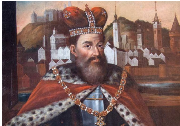
Лев Данилович (1228 г. - 1301 г.)

Умелое правление Льва Даниловича, удачная внешняя политика вкупе с близкими отношениями с Ногаем, который в это время был главной фигурой Восточной Европы, позволили Галицко-Волынскому государству пережить свой новый расцвет, самый большой и, увы, последний. В первую очередь это выразилось в территориальном расширении влияния Романовичей над землями Руси, о чем есть пусть и не стопроцентная, но достаточно весомая информация.