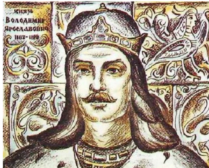
Владимир Ярославич (1151 г. - 1199 г.)

Из неудачи под Галичем был извлечен урок. Понимая, что напрямую завладеть Галичем не получится, Роман повел куда более осторожную и долгоиграющую политику. Были установлены контакты с Владимиром Ярославичем, который находился под стражей и был совершенно не против получить чью-то поддержку. В будущем договоренности с Романом, помимо прочего, обеспечат Владимиру брак его сына от попойки, Василька, с дочерью князя Волыни. Кроме того, не исключено, что именно при содействии князя с Волыни Владимир в результате бежал из-под стражи в Германию, где получил у Штауфенов (родственников Романа) поддержку для возвращения своего княжества.