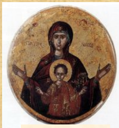
Оранта 15-16 в.