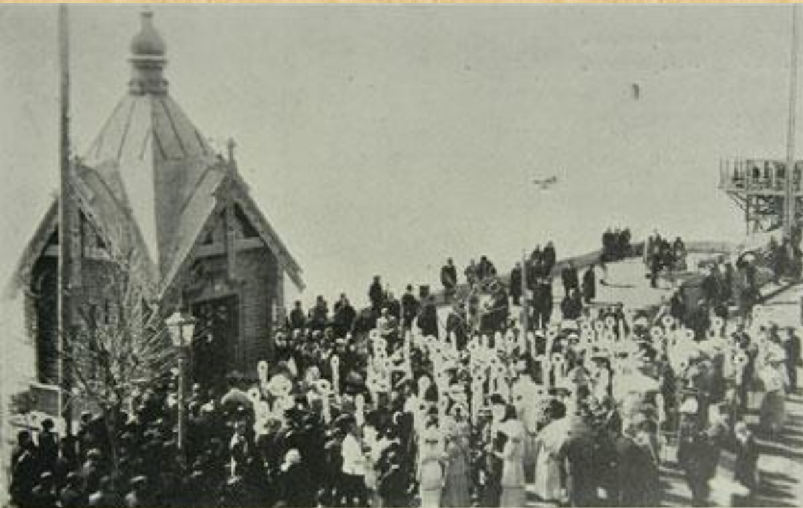
Ялта. Молебствие у часовни на набережной в день «блага цветка».

С 1911 по инициативе Государя Николая II, «Дни цветков» стали проводится во многих городах России. В поддержку акции в День Белого цветка про-водили благотворитель-ные базары, работали