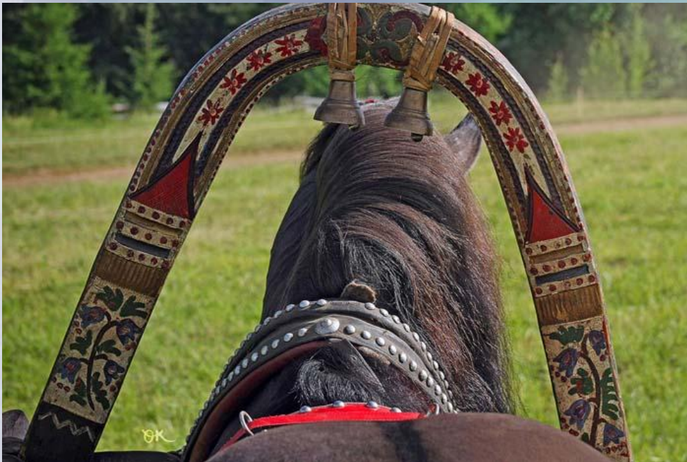
Расписные конские дуги