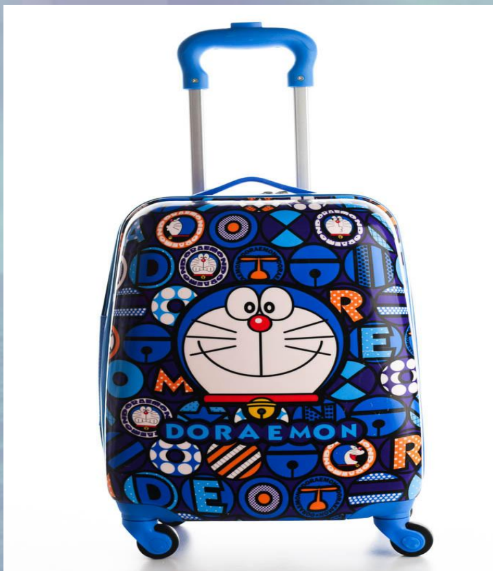
ЭТО ЧЕМОДАН БРАТА