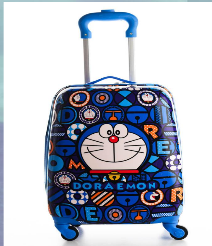
ЭТО ЧЕМОДАН СЕСТРЫ