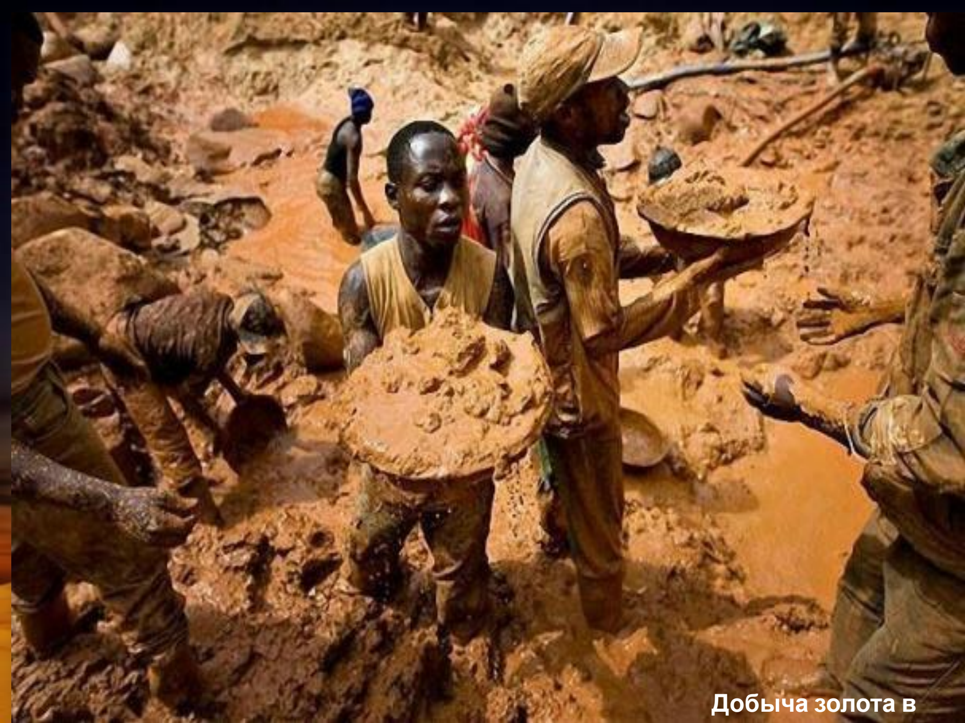
Добыча золота в Конго