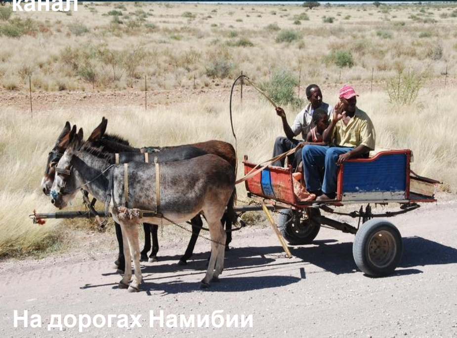
На дорогах Намибии