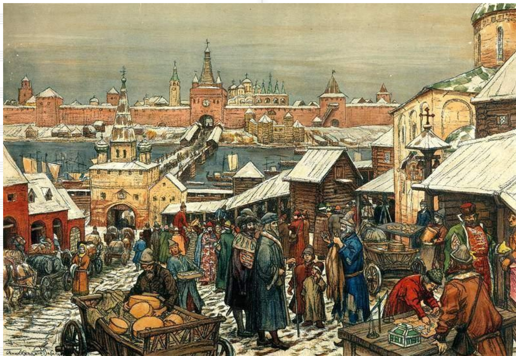
Новгородский торг. А. Васнецов