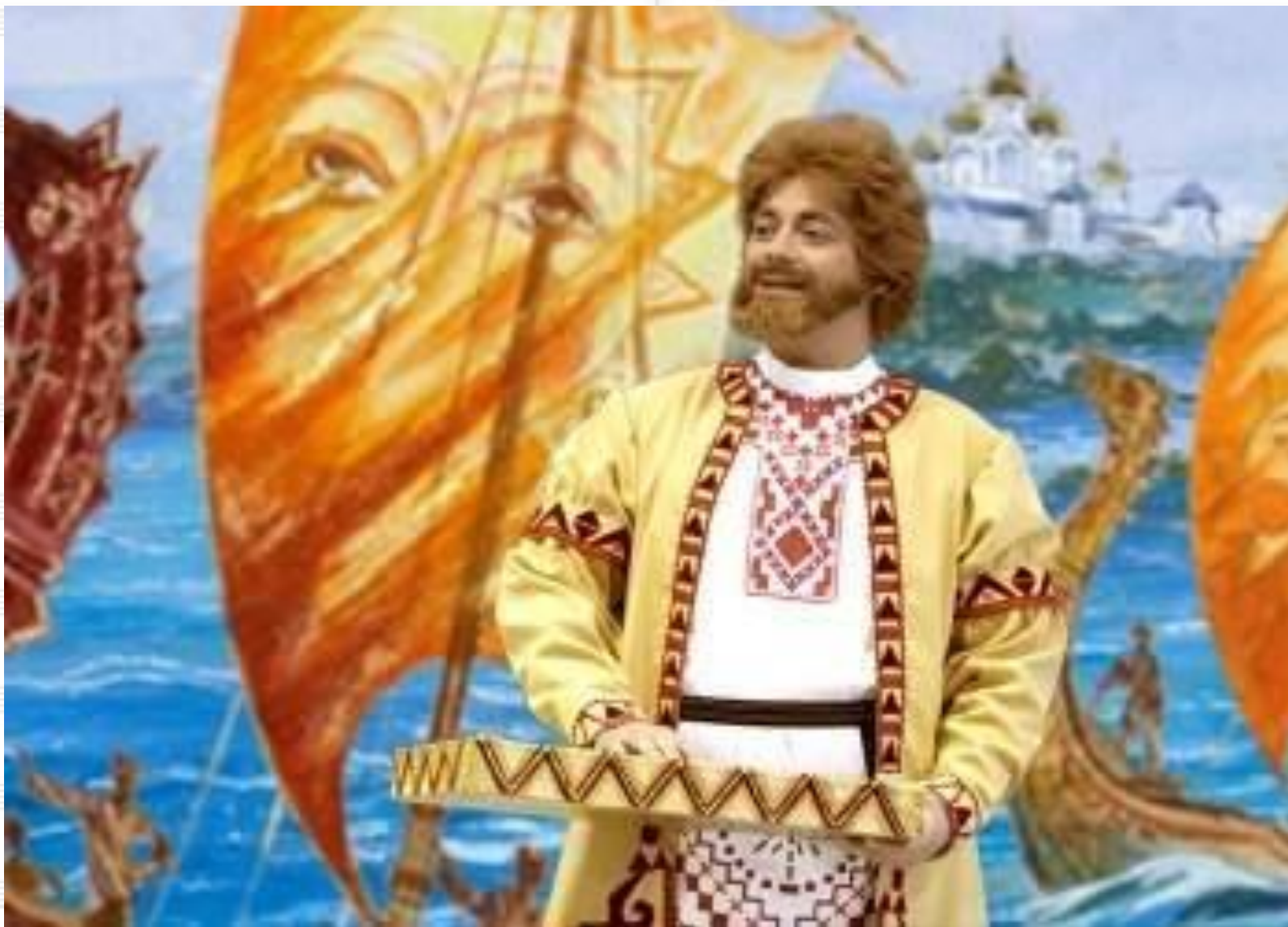
Сцена из оперы