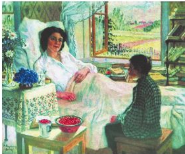
Н. П. Богданов-Бельский. У больной учительницы