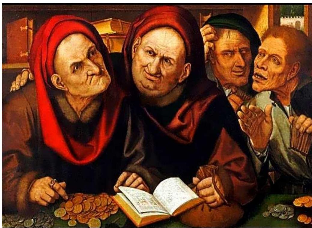
Квентин Массейс. Менялы

Диалог искусств помогает пережить нравственные ценности.