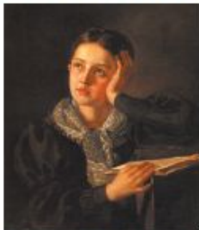
А. В. Тыранов. Девушка, опирающаяся на руку