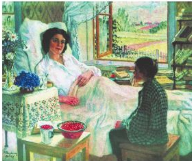
Н. П. Богданов-Бельский. У больной учительницы