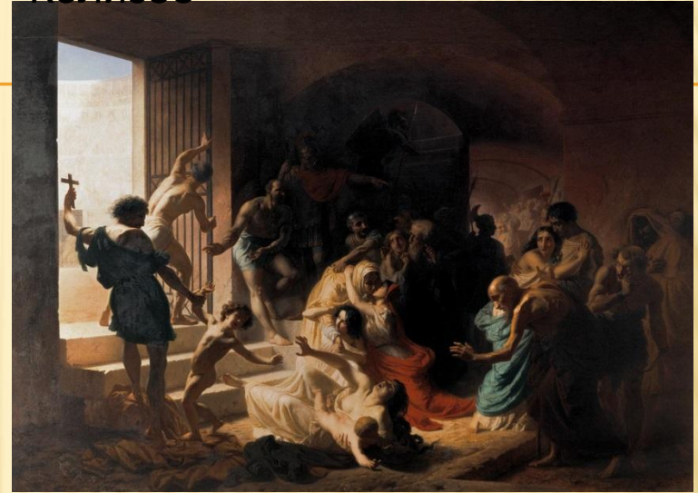
Христианские мученики в Колизее