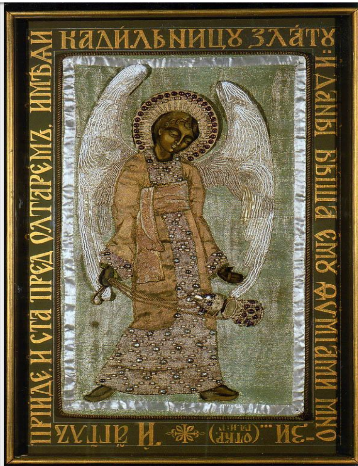
Ангел с кадилом.