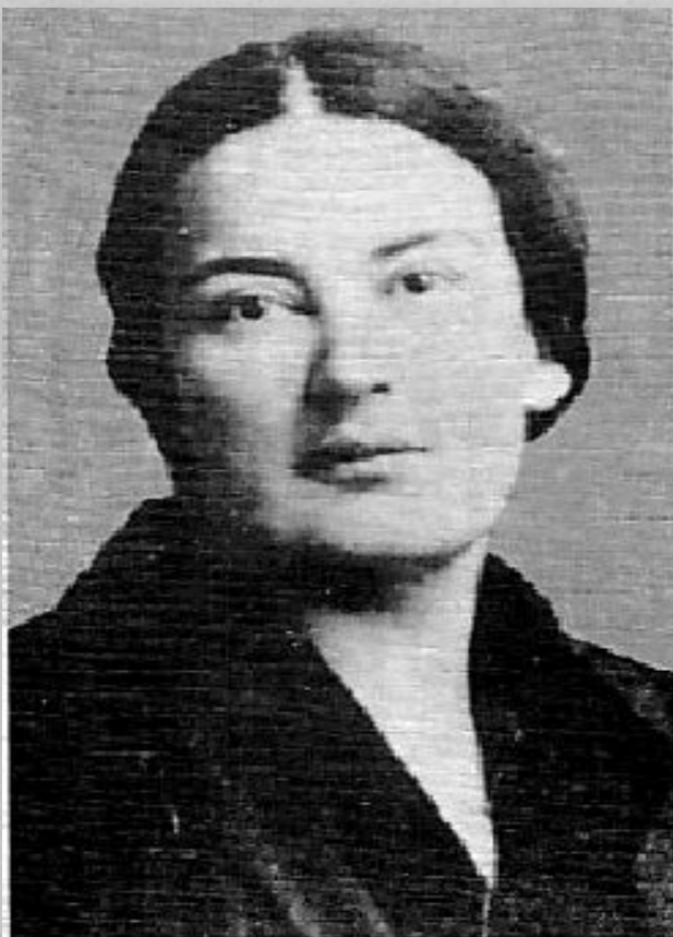
Елизавета Юрьевна Кузьмина-Караваева (Мать Мария).

«Есть два способа жить: совершенно законно и почтенно ходить по суше - мерить, взвешивать, предвидеть. Но можно ходить по водам. Тогда нельзя мерить и предвидеть, а надо только всё время верить. Мгновение безверия - и начинаешь тонуть».