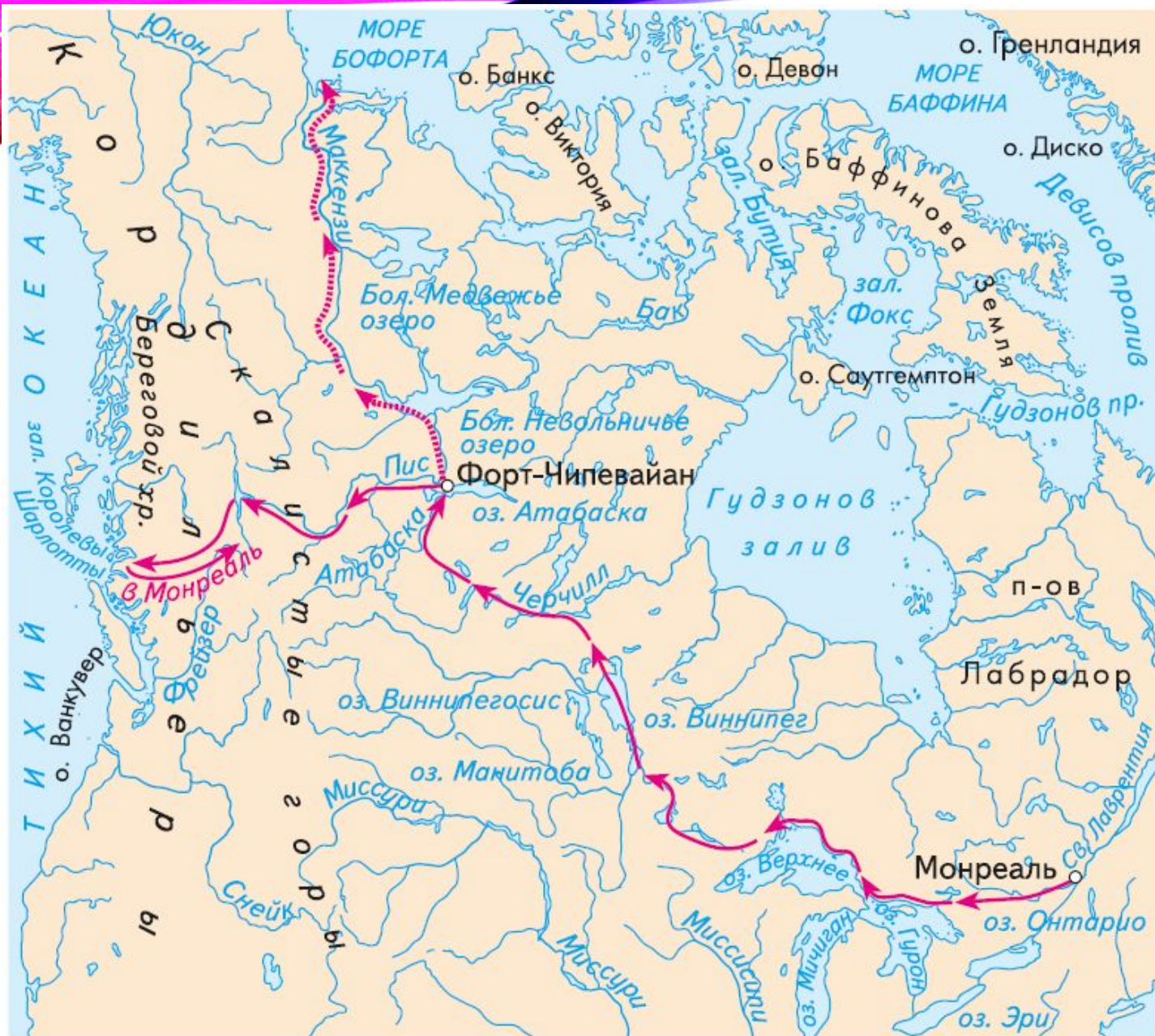
Маршруты экспедиций А. Маккензи