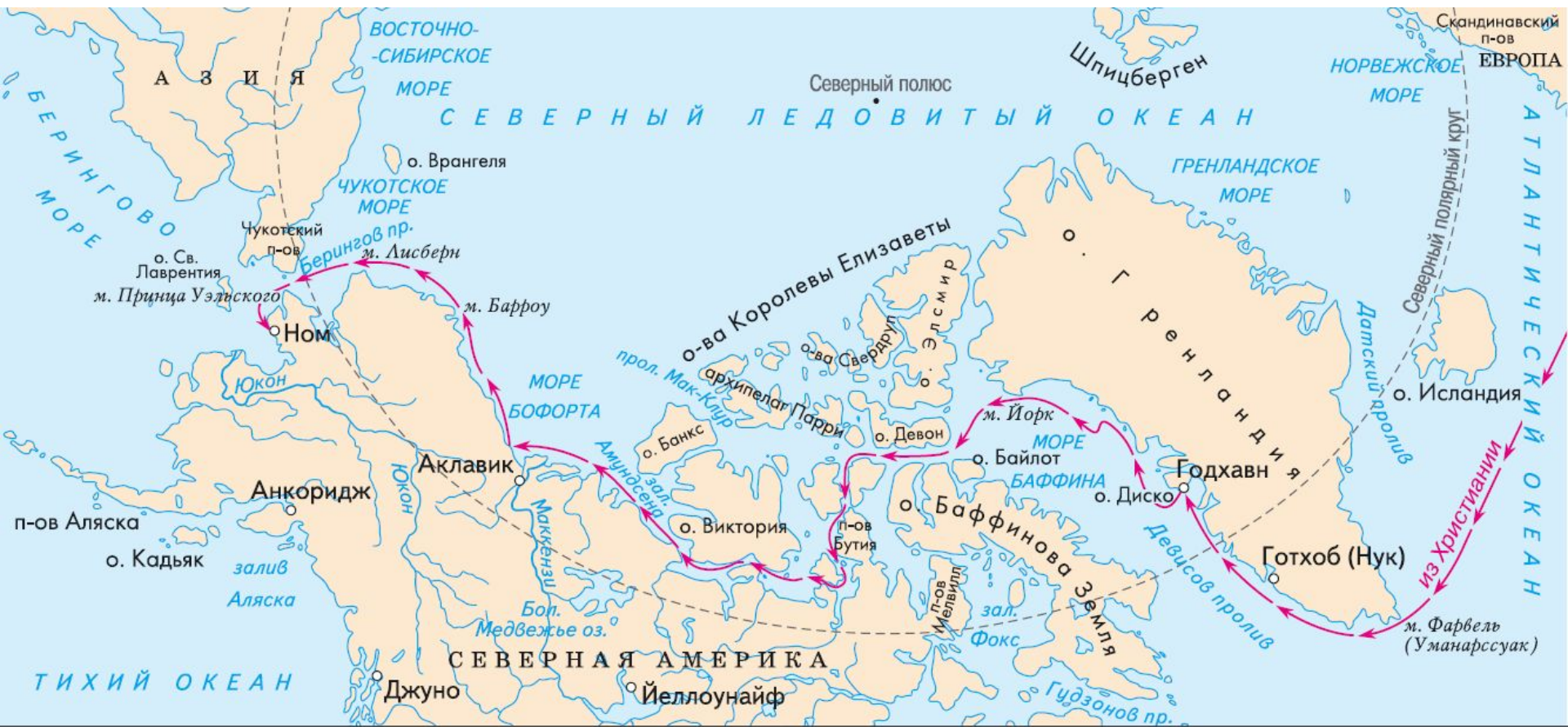
← Маршрут экспедиции Р. Амундсена 1903—1906 гг.