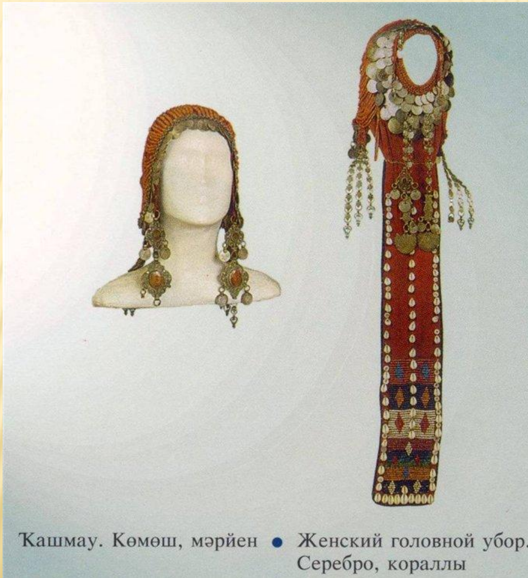
Кашмау. Көмөш, мәрйен ● Женский головной убор. Серебро, кораллы