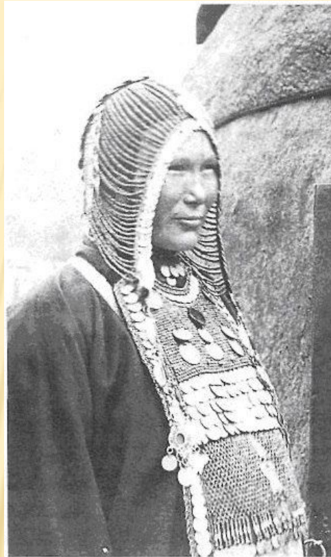
Рис. 151. Башкирка в головном уборе кашмау и нагруднике сел-тар . Тамьян-гангаурцы