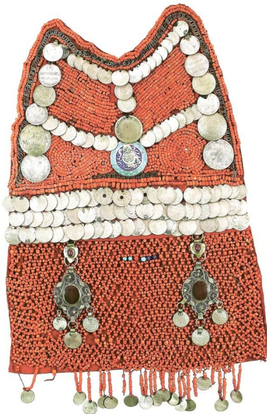
12. Нагрудник сакал

Ткань, серебро, металл, кораллы, пластмасса Экспедиция Н. В. Бичбулатова, 1972 г. ЦЭИ УНЦ РАН. Инв. № 421-5