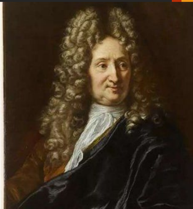
Шарль Луи Монтескье