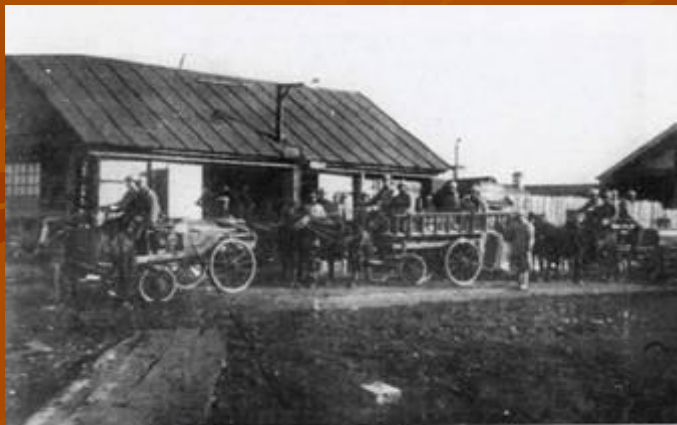
г. Самара. Выезд пожарного обоза.