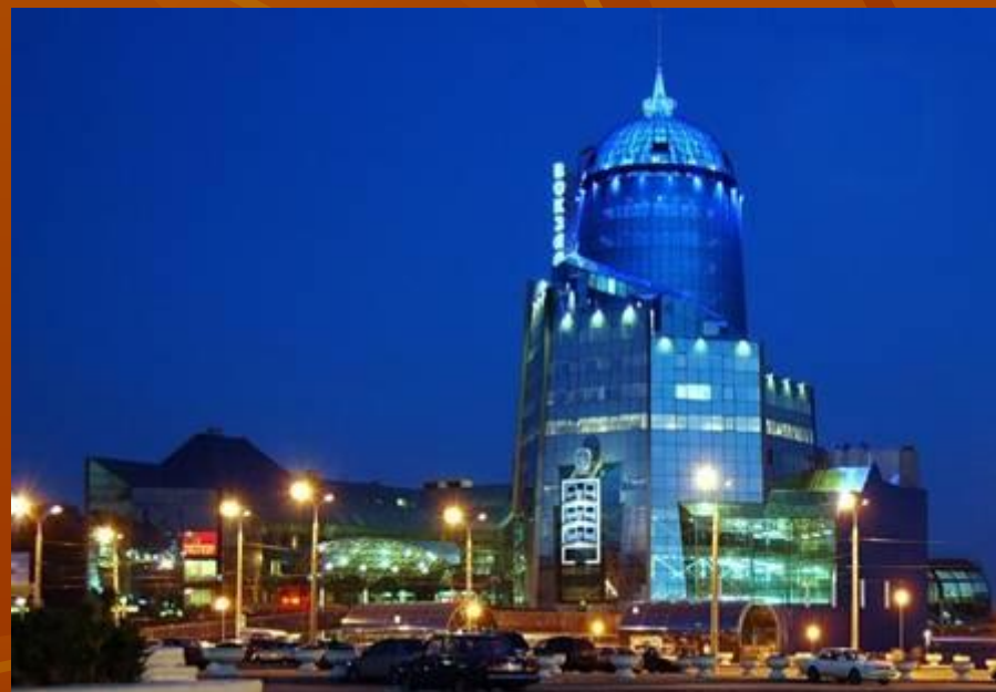
Самара. Вокзал жел. дор.