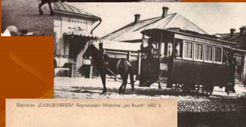
Пароходъ „САМОДЕРЖИЦЪ“ Пароходнаго Общества „по Волгѣ“ 1843 г.