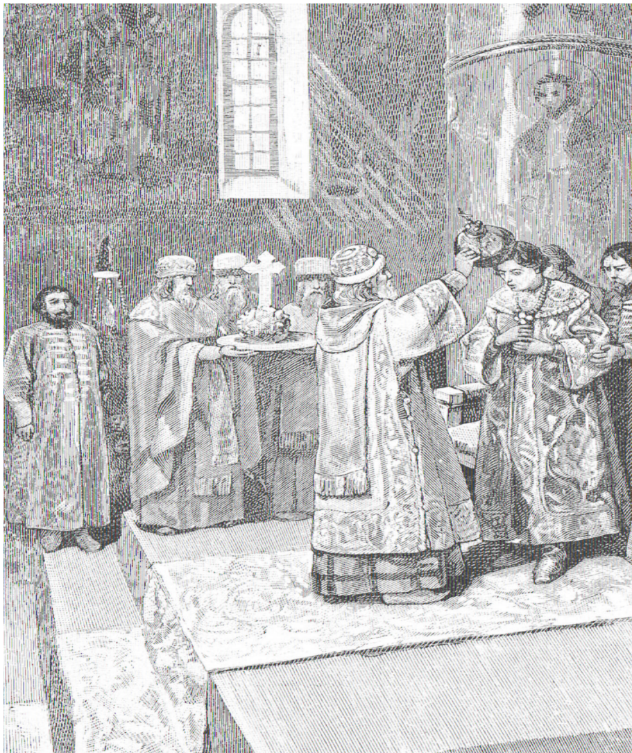
Венчание на царство Ивана 4