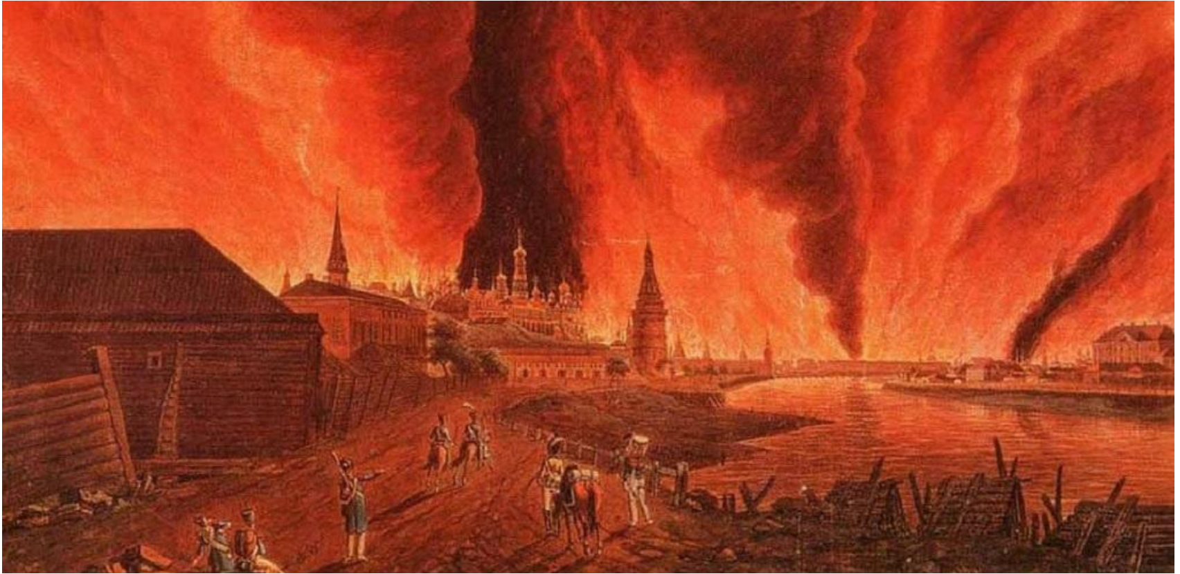
Московское восстание 1547 год