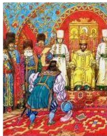
Иван Висковатый, дьяк Посольского приказа