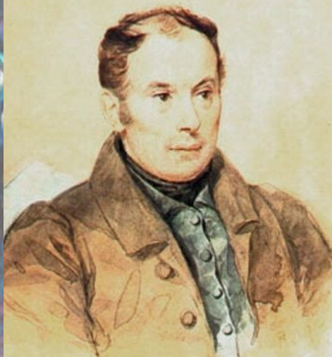
К. Брюллов Портрет Жуковского