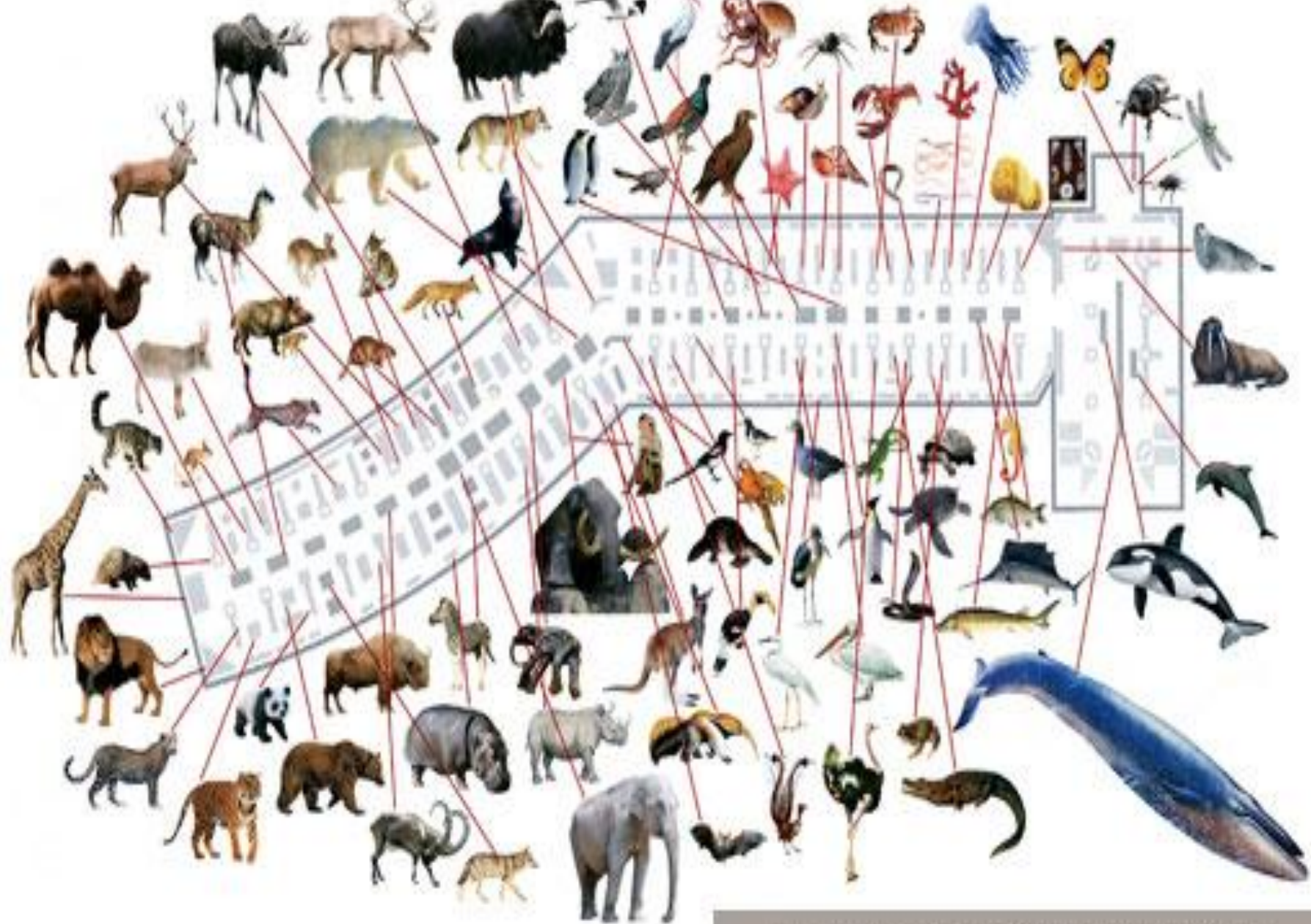
ПЛАН ЭКСПОЗИЦИИ МУЗЕЯ