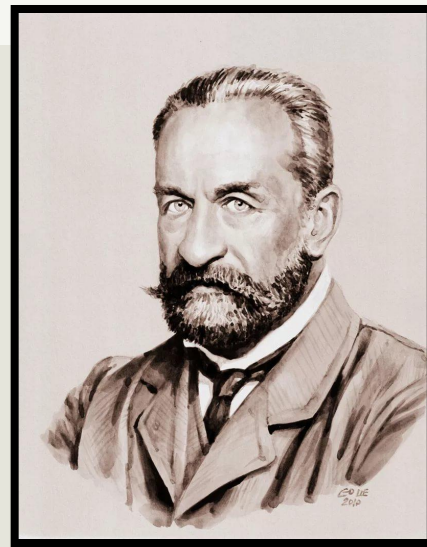
Г.Е. Львов (1861-1925)

Князь, общественный и государственный деятель. В I мировую войну возглавлял «Земский союз» и «Земгор»