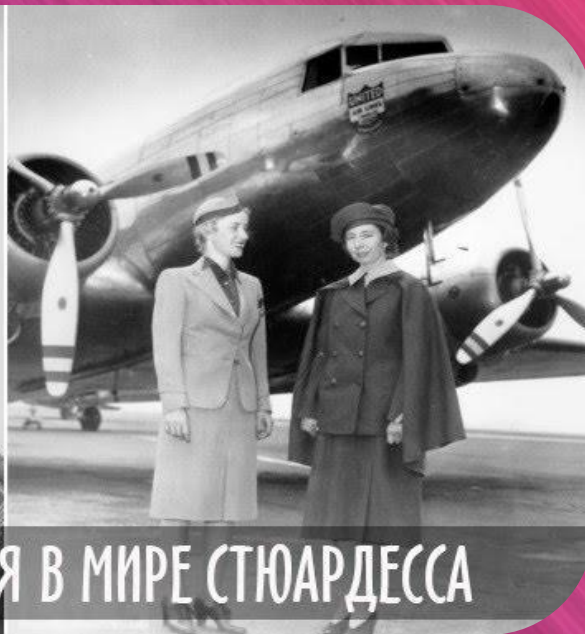
ЭЛЛЕН ЧЕРЧ — ПЕРВАЯ В МИРЕ СТЮАРДЕССА