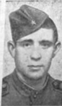
Ф. Г. Поплавский