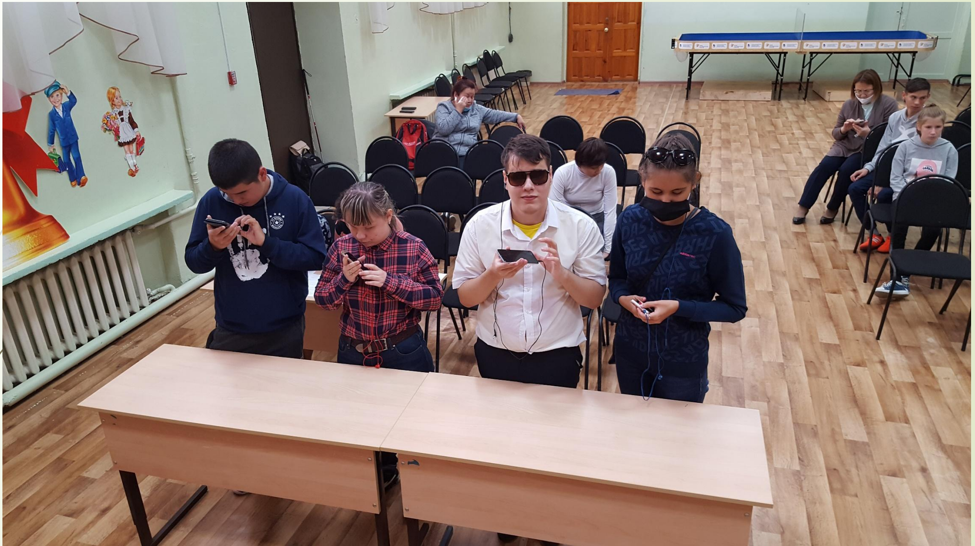
организация и поведение занятий по обучению незрячих компьютерной грамотности для незрячих, по работе с сенсорным экраном, смартфоном и другими цифровыми средствами технической реабилитации