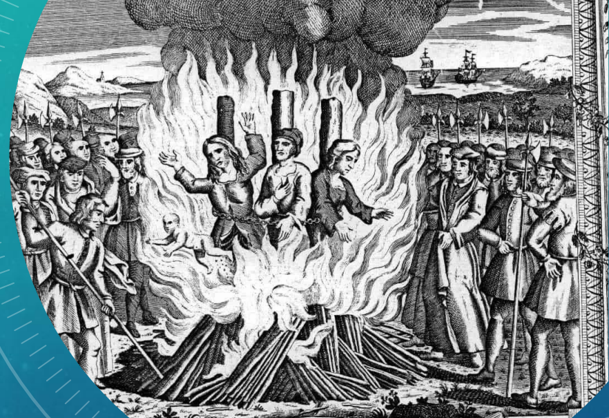
Burning of Katherine Garches, and her two children in the Isle of Garnsey. Act directs for Ill Tropp. Later nofter Row