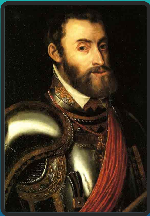
Карл V- император Священной Римской империи германской нации.

Тем не менее Каролина не уничтожила значения партикулярного законодательства отдельных стран; она содержит в себе так называемую сальваторную клаузулу (лат. clausula salvatoria ) о том, что издаваемым уложением не уничтожаются «разумные» обычаи, которыми князьям, курфюрстам и сословиям предоставляется руководствоваться в последующем.