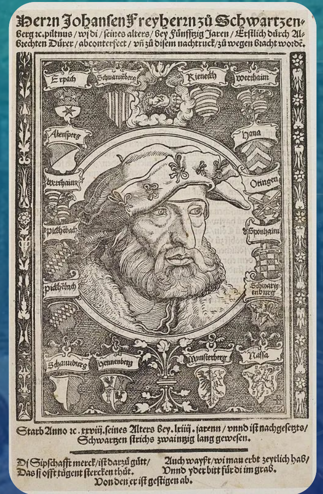
Иоганн фон Шварценберг