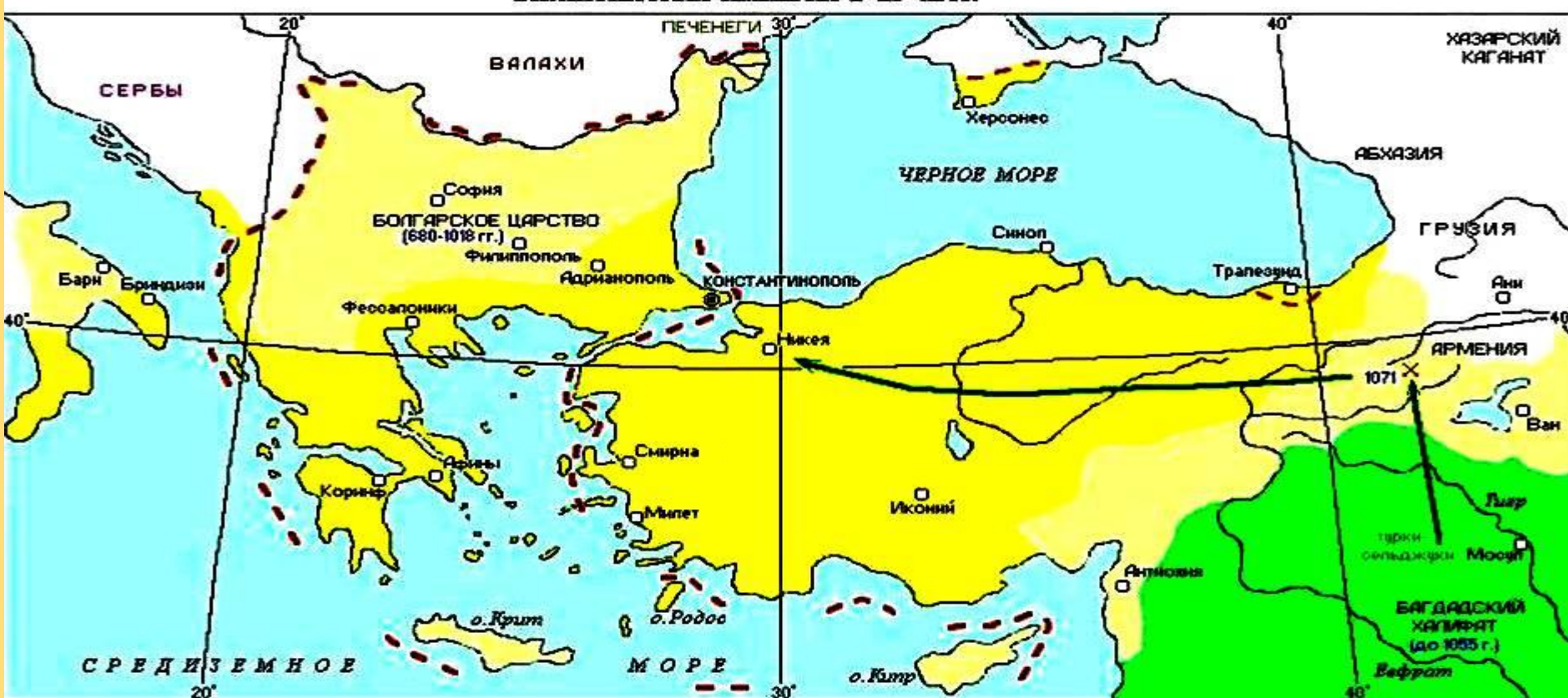
ВИЗАНТИЙСКАЯ ИМПЕРИЯ В IX - XI вв.