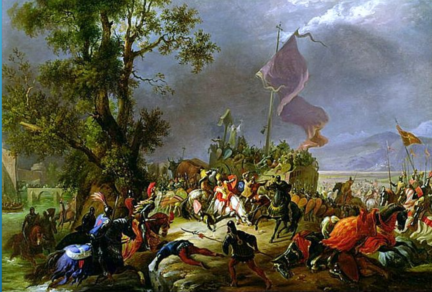
Битва при Леньяно (Legnano) 1176г.

ЛОМБАРДСКАЯ ЛИГА СИЛАМИ ГОРОДСКИХ ОПОЛЧЕНИЙ НАГОЛОВУ РАЗБИЛА РЫЦАРЕЙ ФРИДРИХА I ВЫНУДИВ ПОСЛЕДНЕГО В 1183 ГОДУ ПРИЗНАТЬ САМОСТОЯТЕЛЬНОСТЬ ГОРОДОВ ЛОМБАРДСКОЙ ЛИГИ.