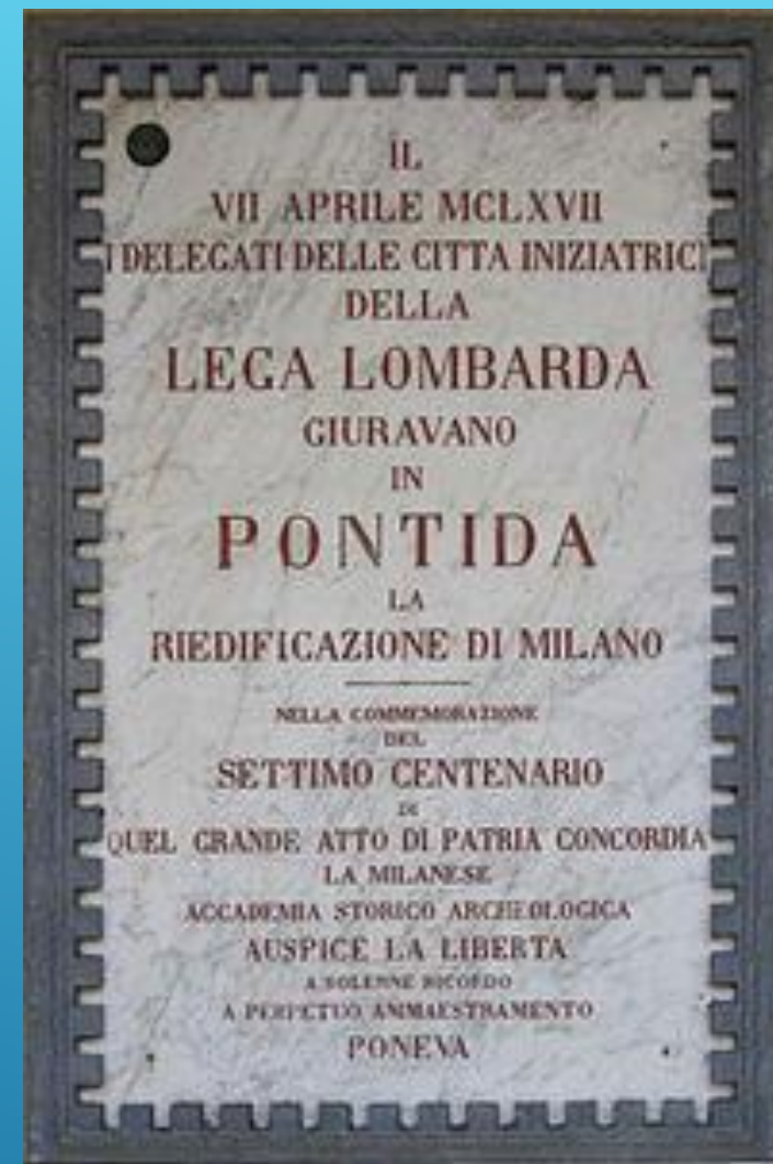
Мемориальная доска в Понтиде, в память о создании Ломбардской лиги