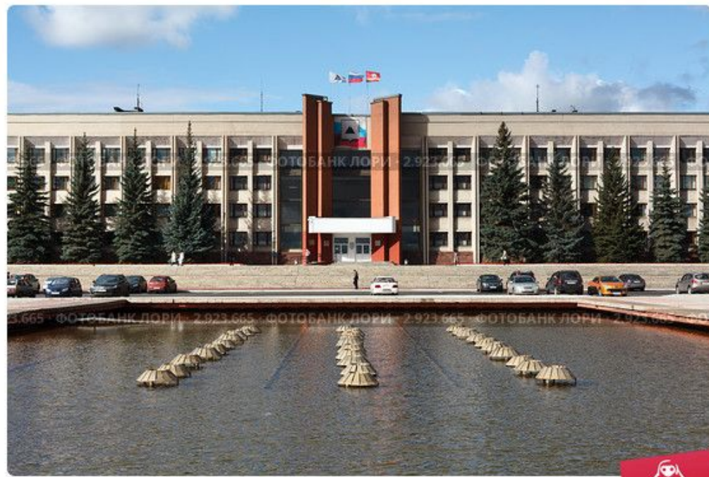
Здание администрации в городе Магнитогорске