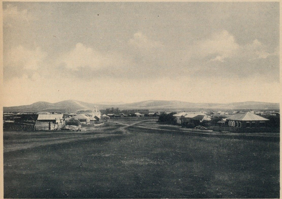
Станица Магнитная, горы на лѣвомъ берегу Урала и гора Магнитная на заднемъ планѣ.