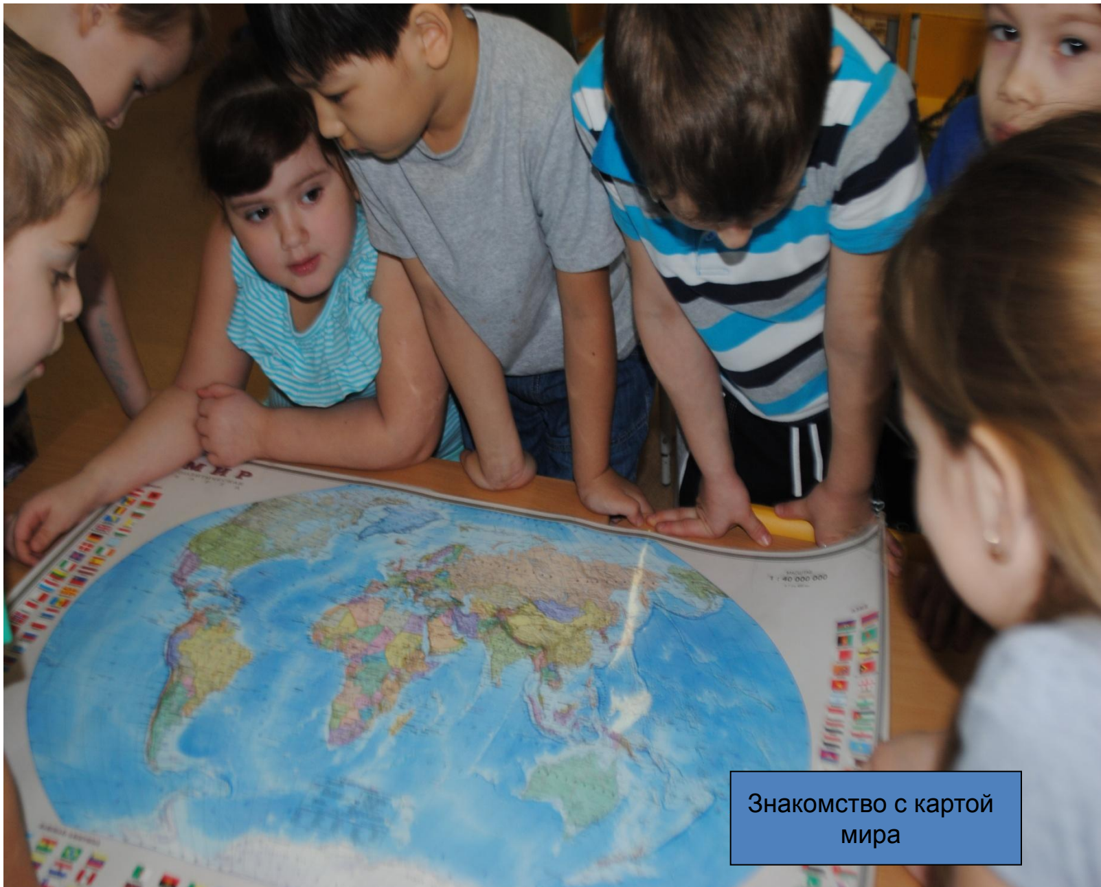
Знакомство с картой мира